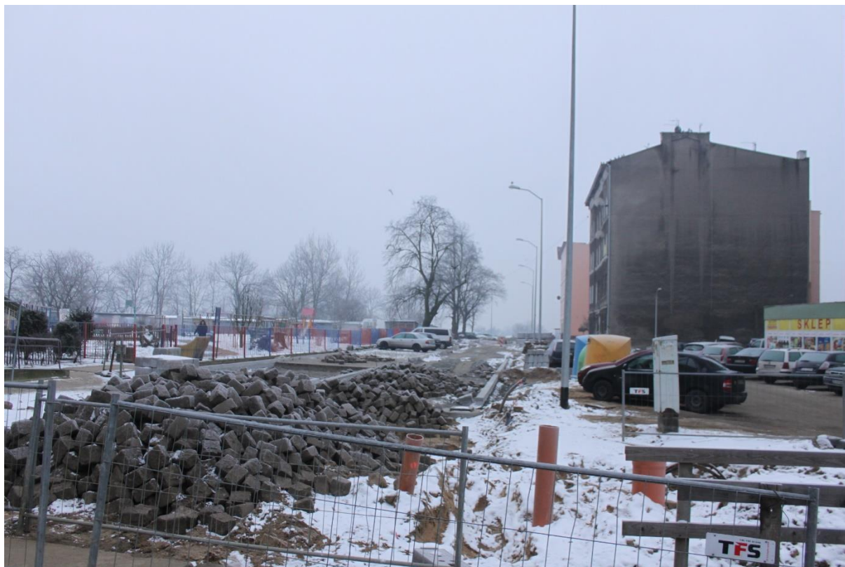
ul. Potulicka od strony Piekar

Umowa o dofinansowanie nr: UDA-RPZP.02.01.03-32-001/13-00 z dnia 26. 09.2013 roku.