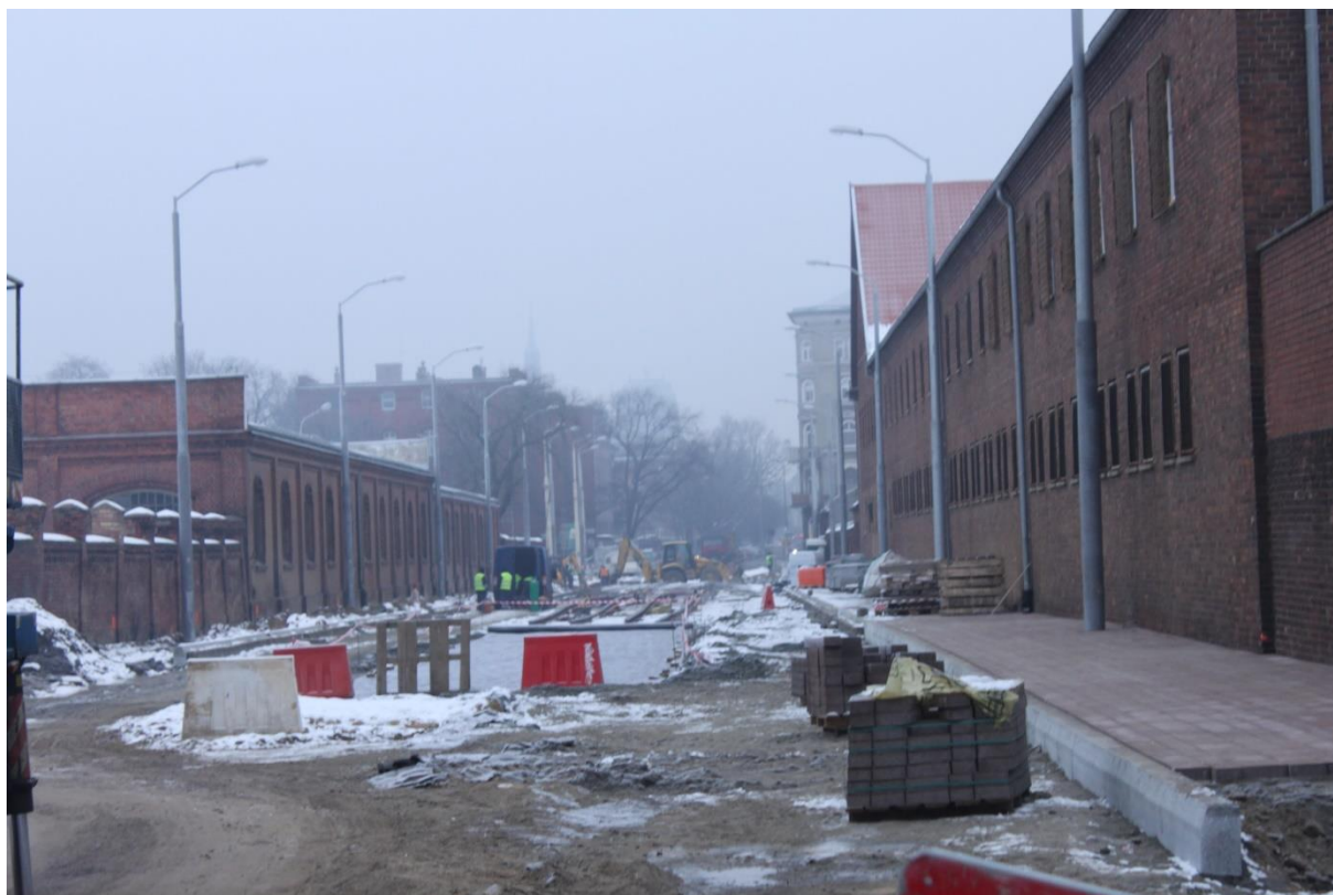
ul. Potulicka od strony ul. Czarneckiego

Umowa o dofinansowanie nr: UDA-RPZP.02.01.03-32-001/13-00 z dnia 26. 09.2013 roku.