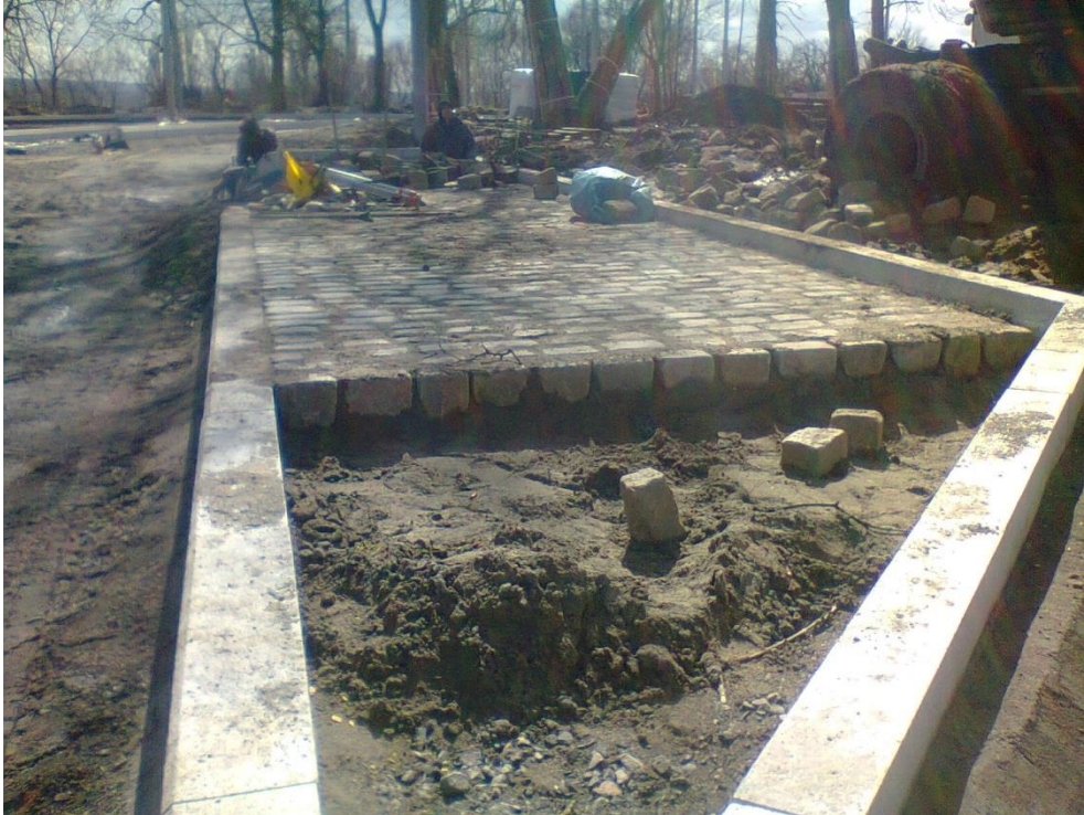
ul. Potulicka - pętla tramwajowa

Umowa o dofinansowanie nr: UDA-RPZP.02.01.03-32-001/13-00 z dnia 26. 09.2013 roku.