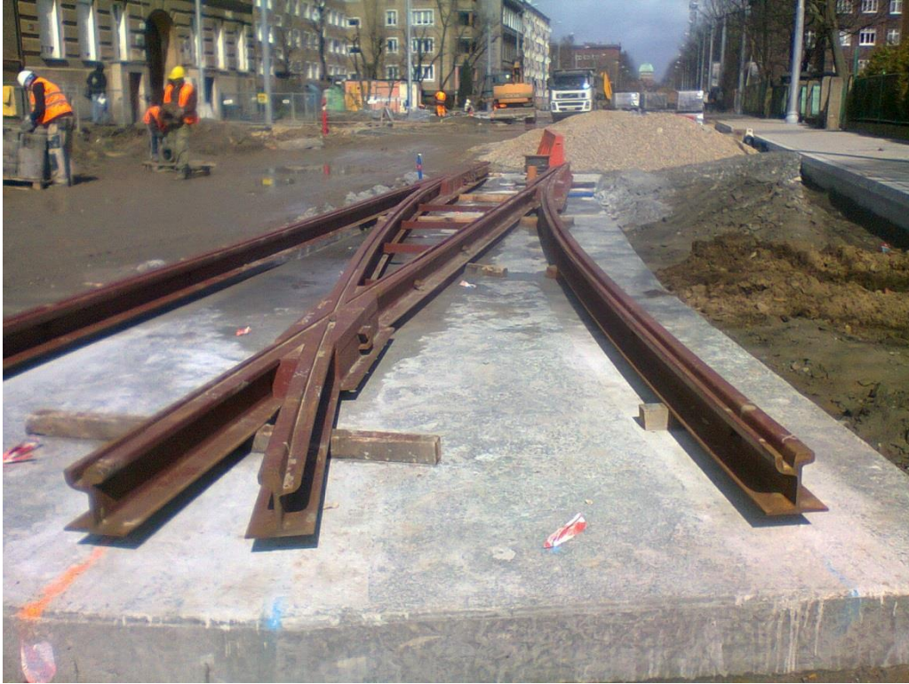
ul. Potulicka - pętla tramwajowa

Umowa o dofinansowanie nr: UDA-RPZP.02.01.03-32-001/13-00 z dnia 26. 09.2013 roku.