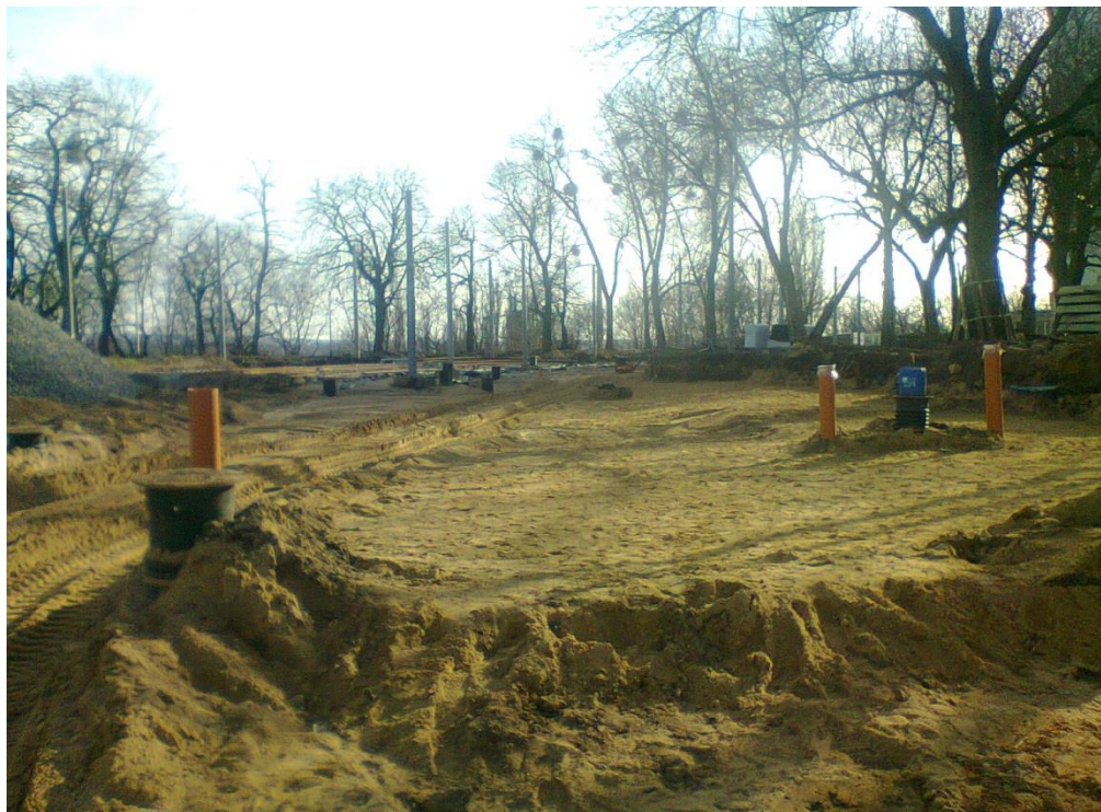
ul. Potulicka – teren pętli tramwajowej

Umowa o dofinansowanie nr: UDA-RPZP.02.01.03-32-001/13-00 z dnia 26. 09.2013 roku.