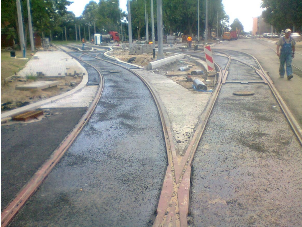
ul. Potulicka – pętla tramwajowa

Umowa o dofinansowanie nr: UDA-RPZP.02.01.03-32-001/13-00 z dnia 26. 09.2013 roku.