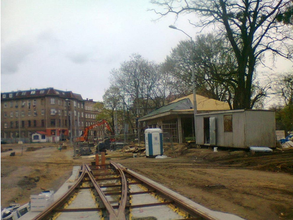
ul. Potulicka – pętla tramwajowa

Umowa o dofinansowanie nr: UDA-RPZP.02.01.03-32-001/13-00 z dnia 26. 09.2013 roku.