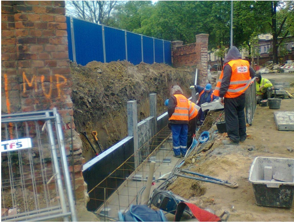
skrzyżowanie ul. Potulickiej z ul. Narutowicza

Umowa o dofinansowanie nr: UDA-RPZP.02.01.03-32-001/13-00 z dnia 26. 09.2013 roku.