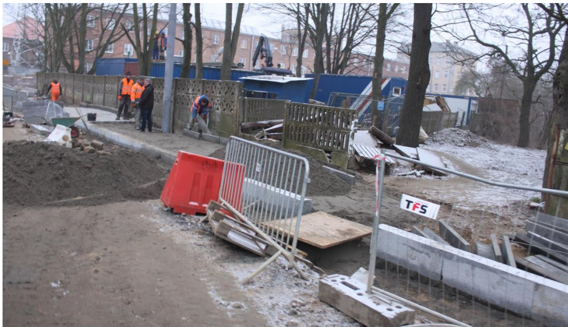
Ul. Potulicka od strony ul. Czarneckiego

Umowa o dofinansowanie nr: UDA-RPZP.02.01.03-32-001/13-00 z dnia 26. 09.2013 roku.