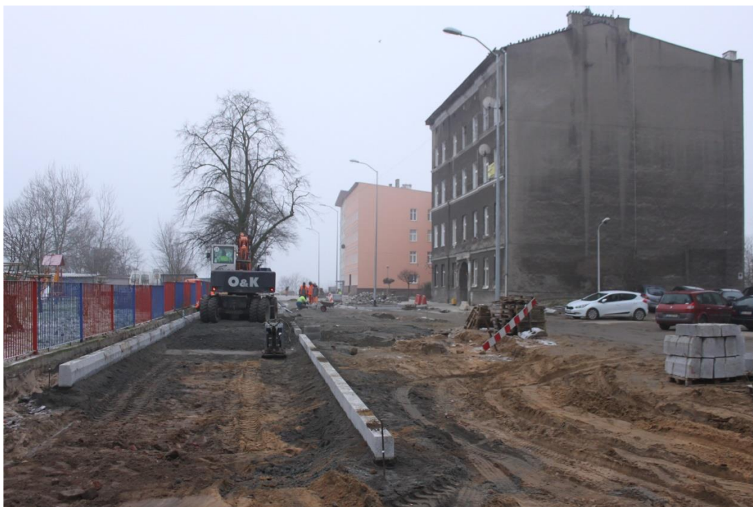
Ul. Potulicka od strony Piekar