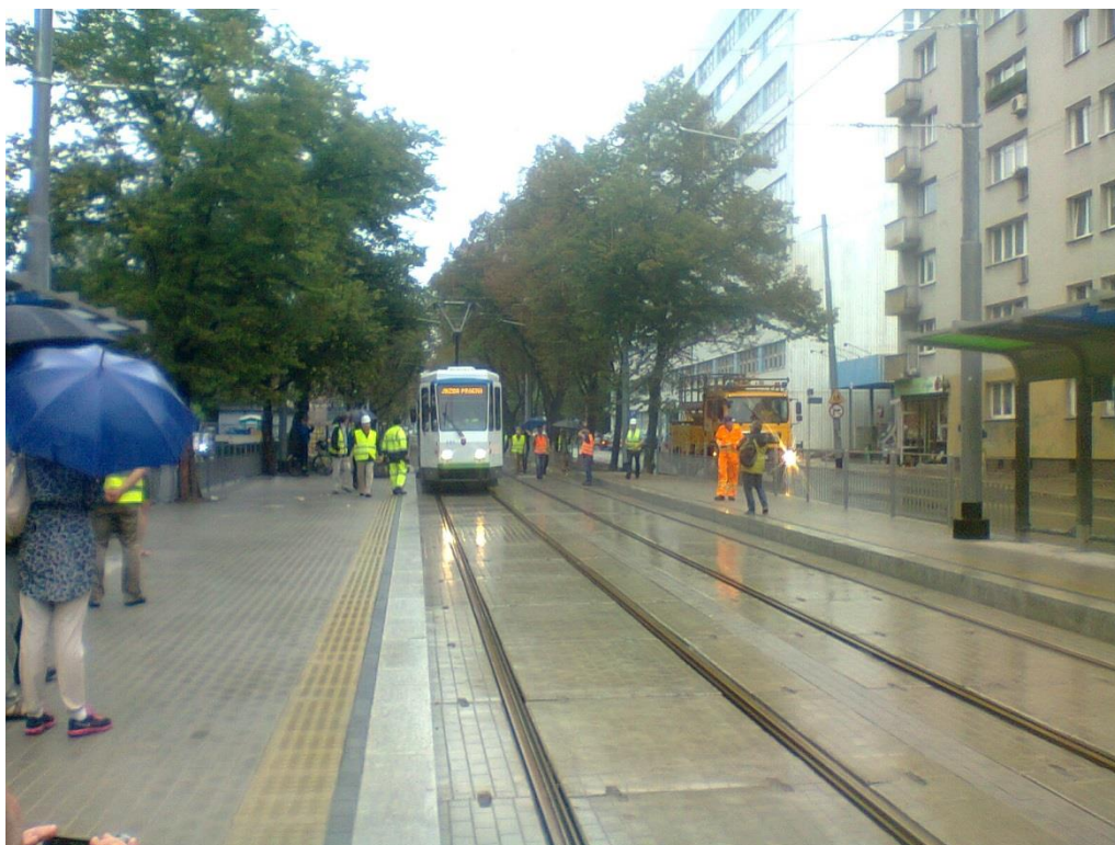
ul. 3 Maja