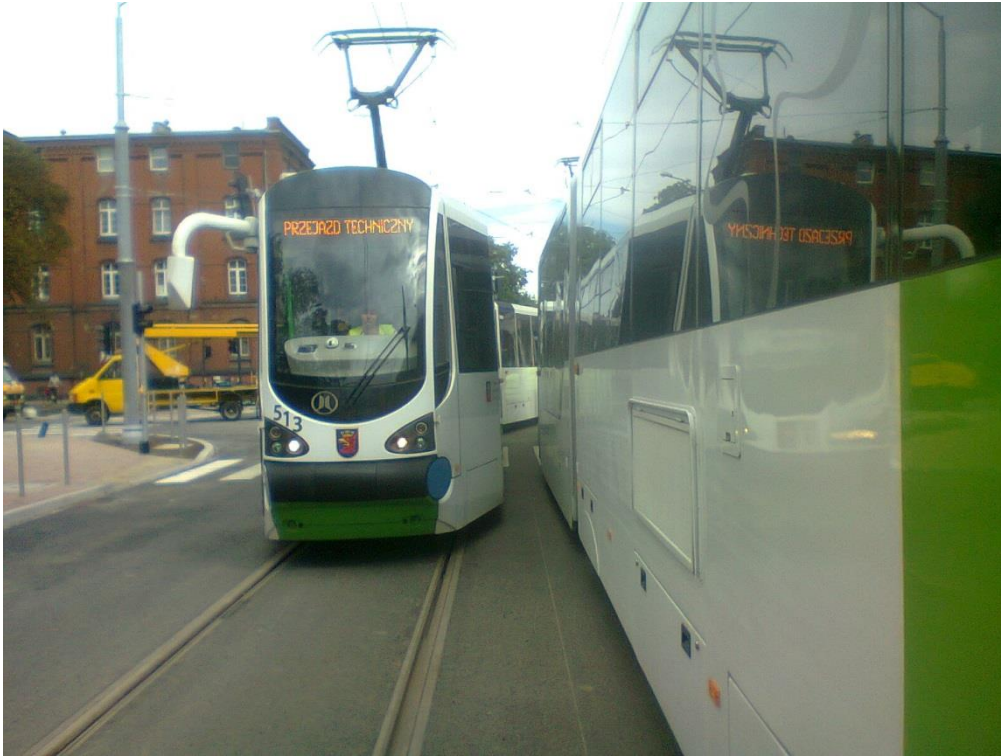
przejazd techniczny - skrzyżowanie ul. Potulickiej i Narutowicza

Umowa o dofinansowanie nr: UDA-RPZP.02.01.03-32-001/13-00 z dnia 26. 09.2013 roku.