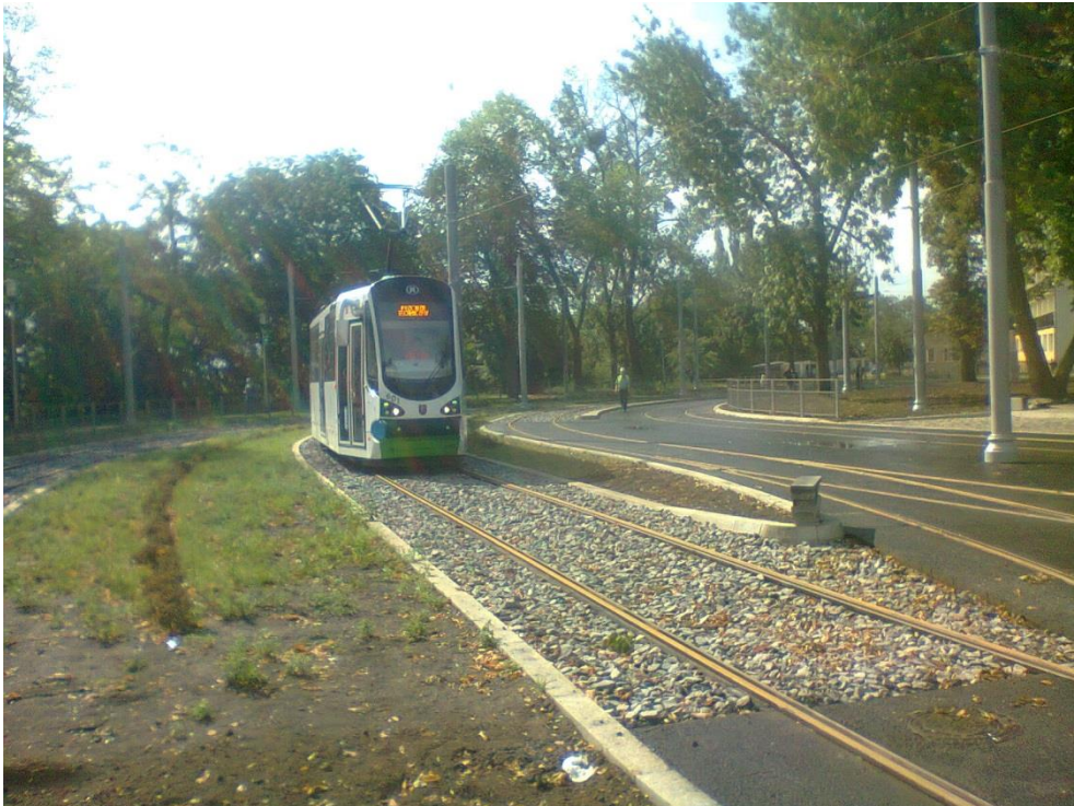
ul. Potulicka, pętla tramwajowa