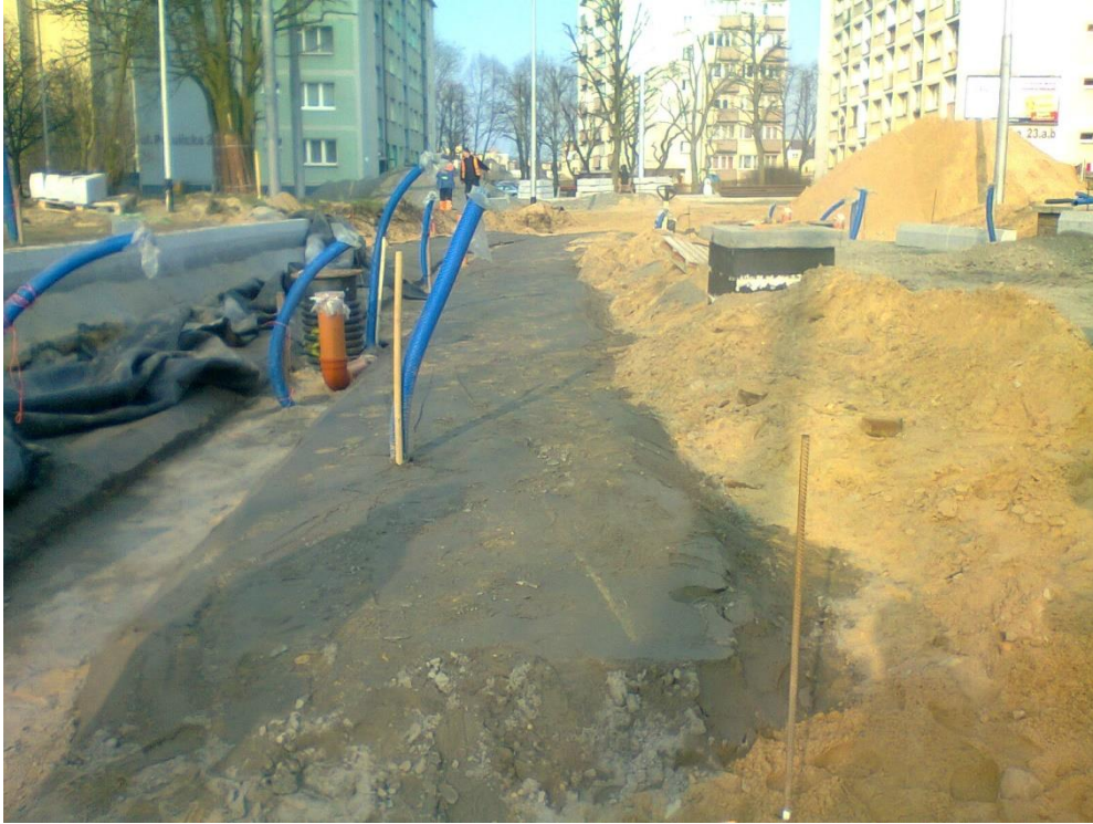
ul. Potulicka - pętla tramwajowa

Umowa o dofinansowanie nr: UDA-RPZP.02.01.03-32-001/13-00 z dnia 26. 09.2013 roku.