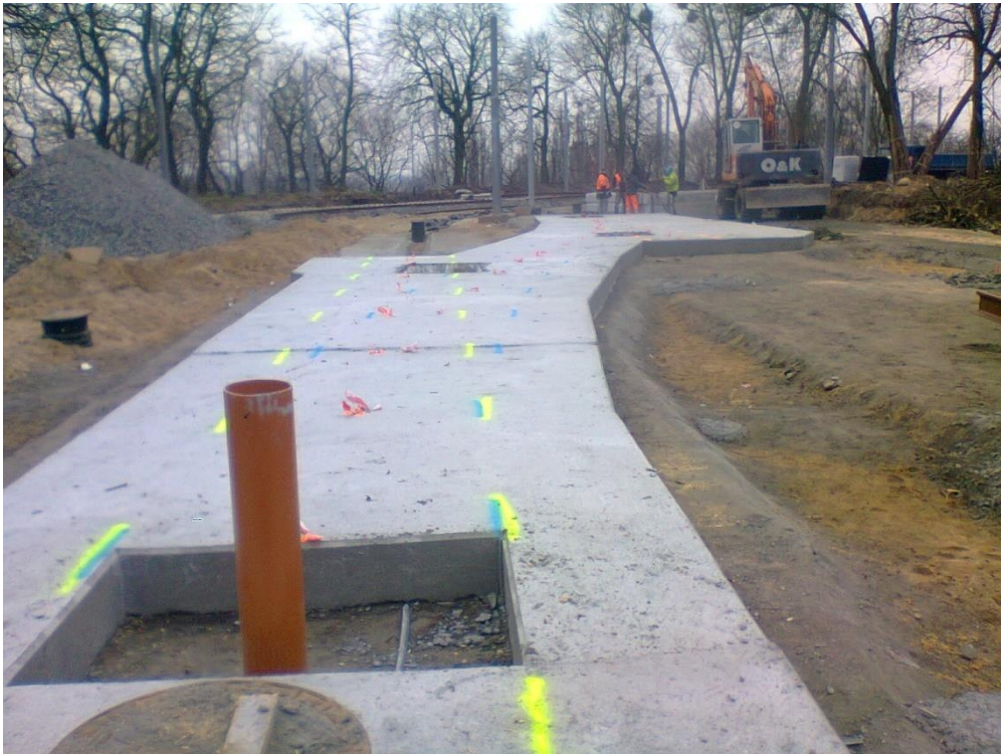
ul. Potulicka –pętla tramwajowa