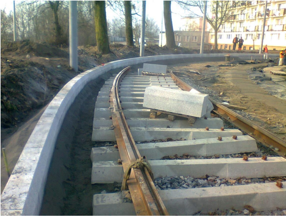
ul. Potulicka – teren pętli tramwajowej

Umowa o dofinansowanie nr: UDA-RPZP.02.01.03-32-001/13-00 z dnia 26. 09.2013 roku.