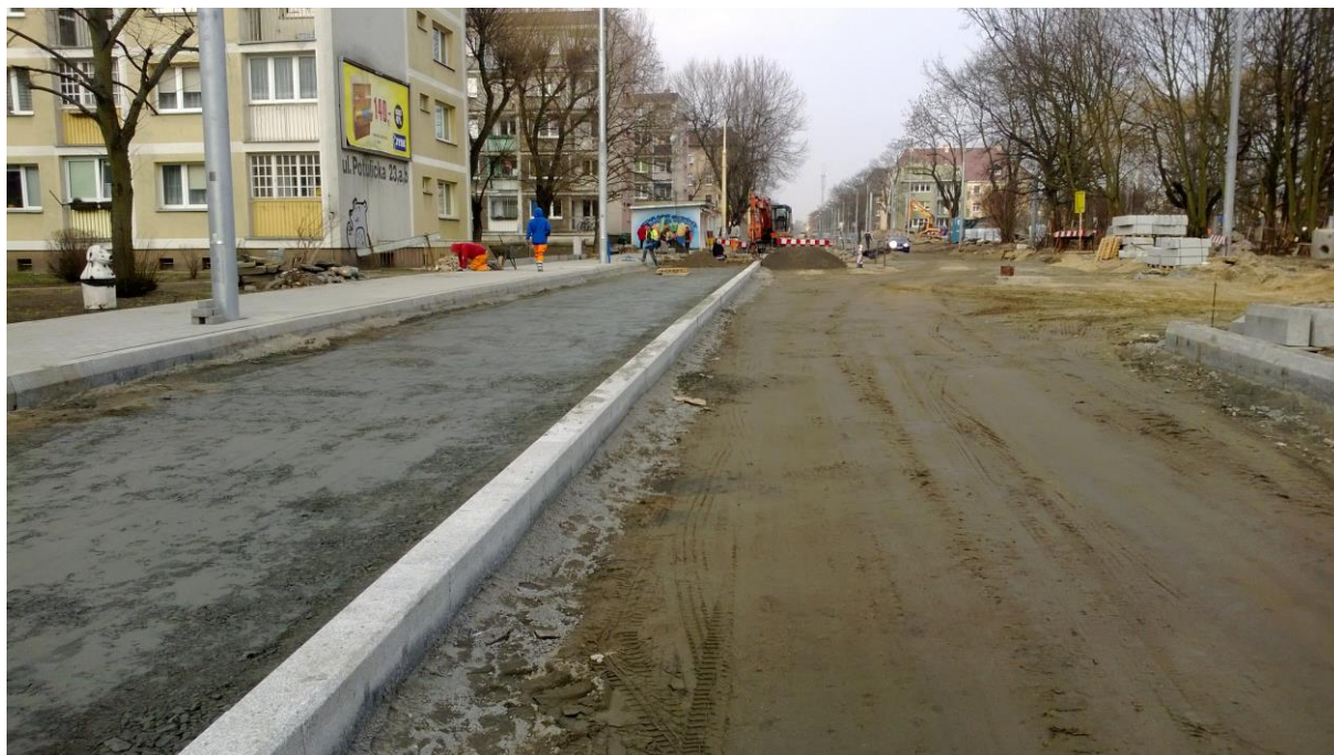
ul. Potulicka w rejonie pętli tramwajowej

Umowa o dofinansowanie nr: UDA-RPZP.02.01.03-32-001/13-00 z dnia 26. 09.2013 roku.