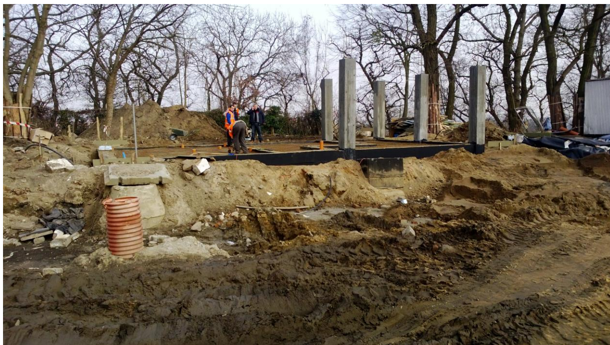
Pętla tramwajowa przy ul.Potulickiej – budowa obiektu socjalno-kasowego

Umowa o dofinansowanie nr: UDA-RPZP.02.01.03-32-001/13-00 z dnia 26. 09.2013 roku.