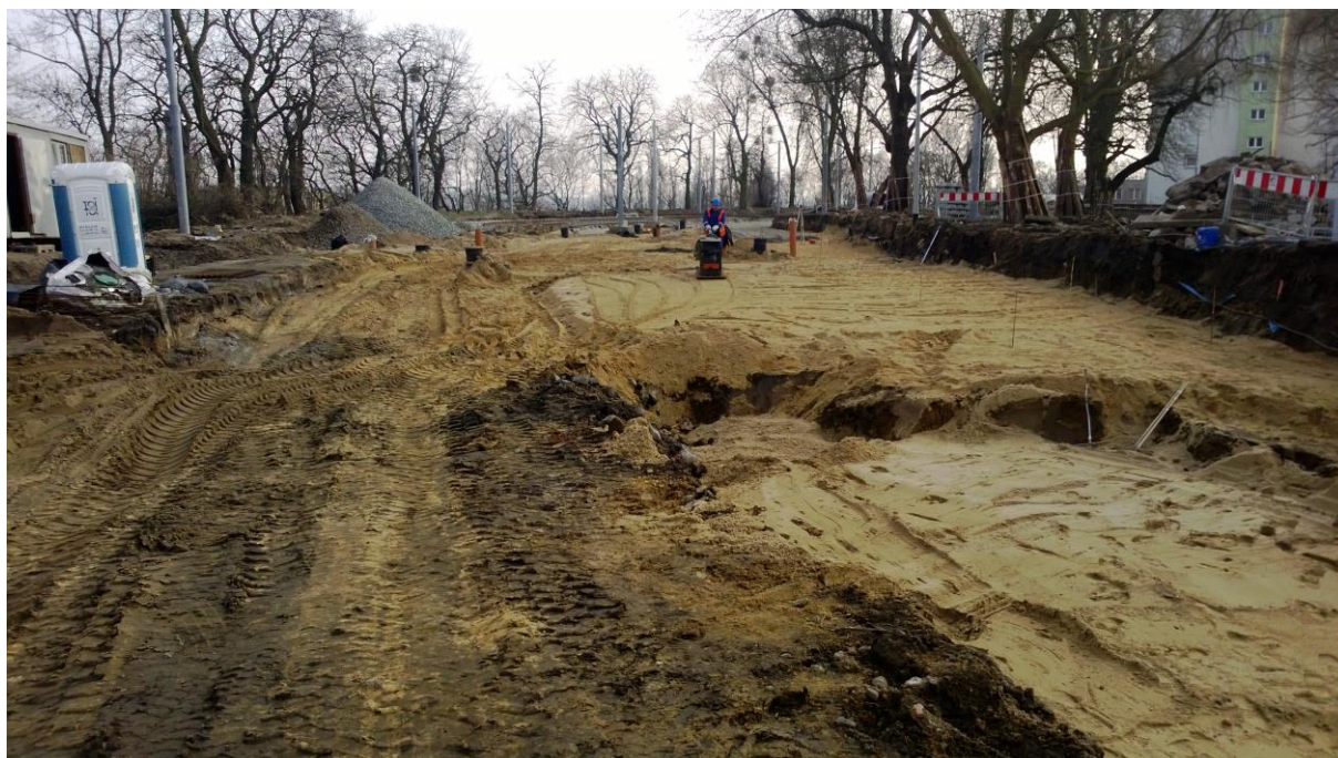
Pętka tramwajowa – roboty ziemne