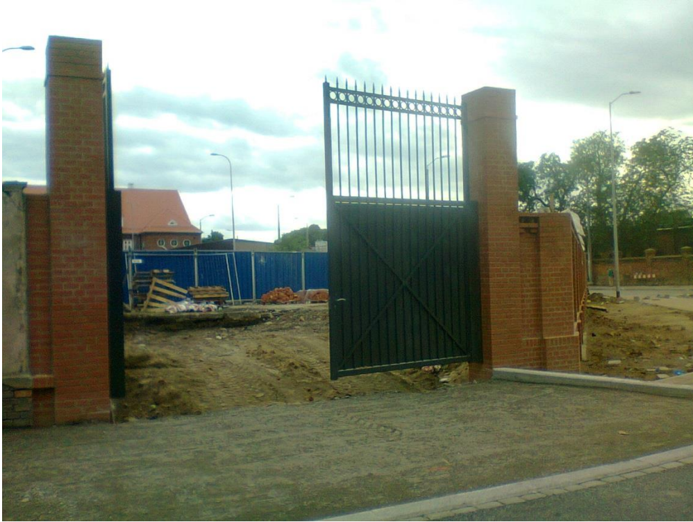
skrzyżowanie ul. Potulickiej z ul. Narutowicza

Umowa o dofinansowanie nr: UDA-RPZP.02.01.03-32-001/13-00 z dnia 26. 09.2013 roku.