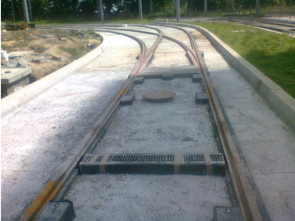
ul. Potulicka – pętla tramwajowa

Umowa o dofinansowanie nr: UDA-RPZP.02.01.03-32-001/13-00 z dnia 26. 09.2013 roku.