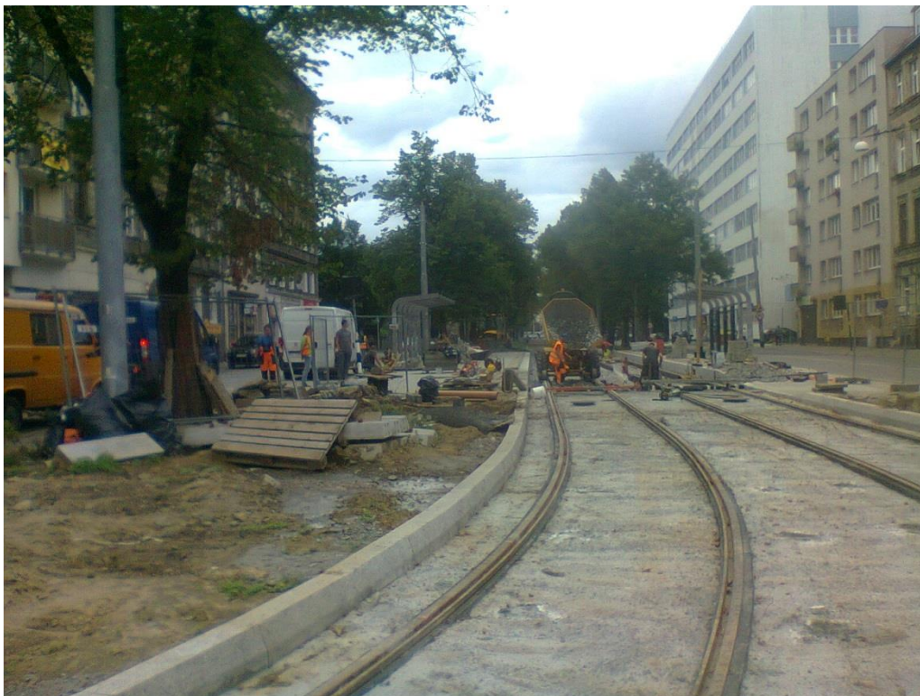
ul. 3 Maja

Umowa o dofinansowanie nr: UDA-RPZP.02.01.03-32-001/13-00 z dnia 26. 09.2013 roku.