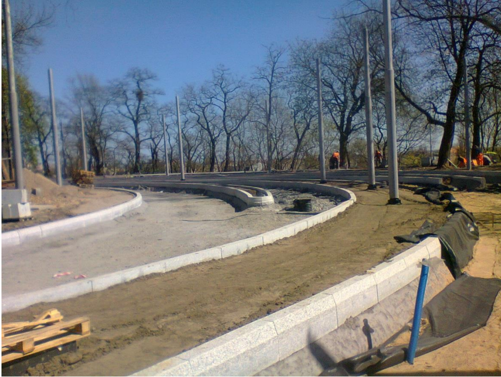
ul. Potulicka - pętla tramwajowa

Umowa o dofinansowanie nr: UDA-RPZP.02.01.03-32-001/13-00 z dnia 26. 09.2013 roku.