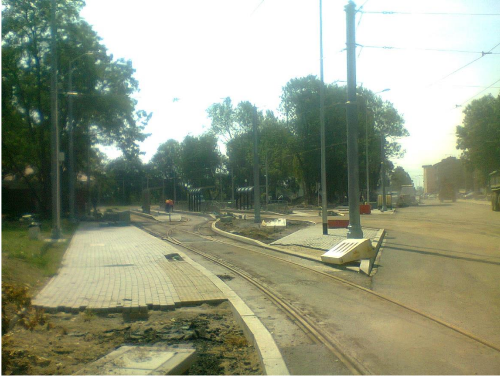
ul. Potulicka, pętla tramwajowa

Umowa o dofinansowanie nr: UDA-RPZP.02.01.03-32-001/13-00 z dnia 26. 09.2013 roku.