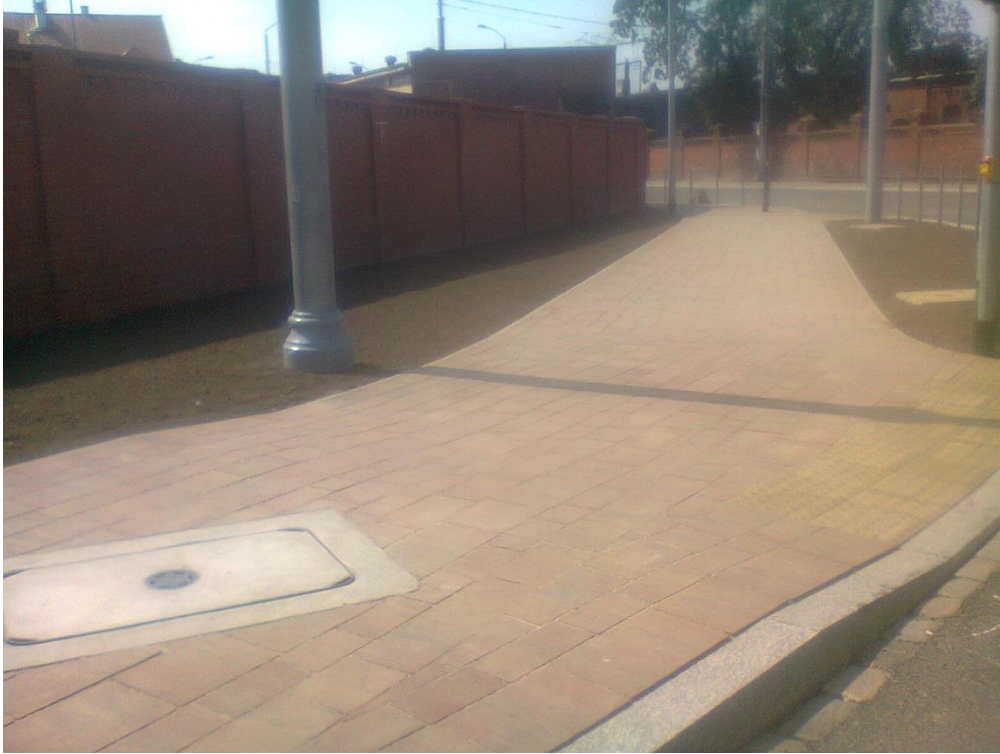
skrzyżowanie ul. Potulickiej i Narutowicza

Umowa o dofinansowanie nr: UDA-RPZP.02.01.03-32-001/13-00 z dnia 26. 09.2013 roku.