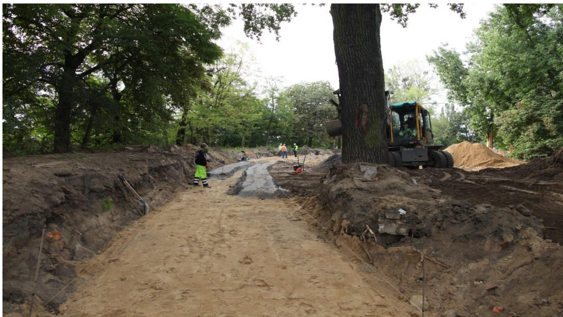
ul. Potulicka –teren pętli tramwajowej – prace związane z drenażem

Umowa o dofinansowanie nr: UDA-RPZP.02.01.03-32-001/13-00 z dnia 26. 09.2013 roku.