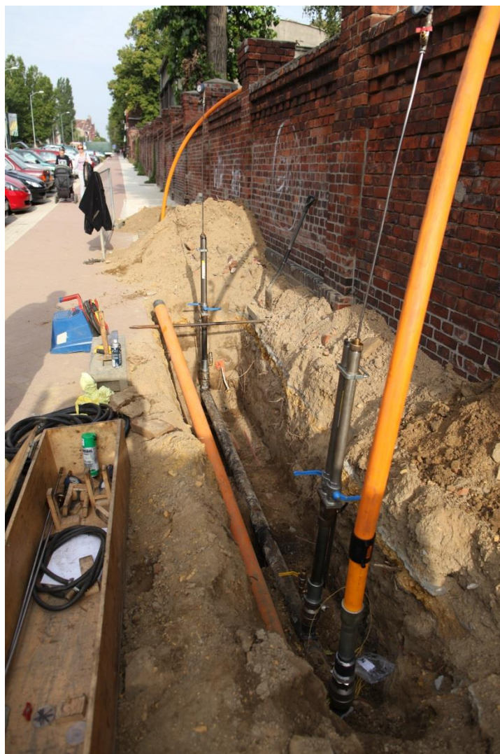
ul. Sowińskiego – prace przy przełączeniu gazociągu

Umowa o dofinansowanie nr: UDA-RPZP.02.01.03-32-001/13-00 z dnia 26. 09.2013 roku.