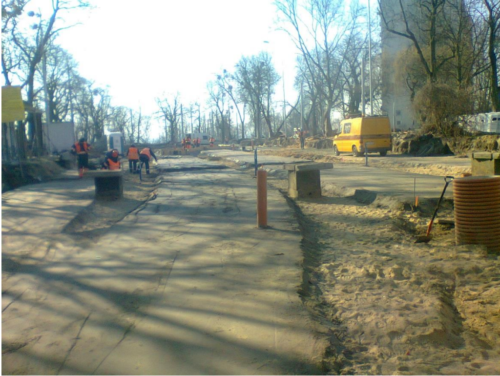
ul. Potulicka – teren pętli tramwajowej

Umowa o dofinansowanie nr: UDA-RPZP.02.01.03-32-001/13-00 z dnia 26. 09.2013 roku.