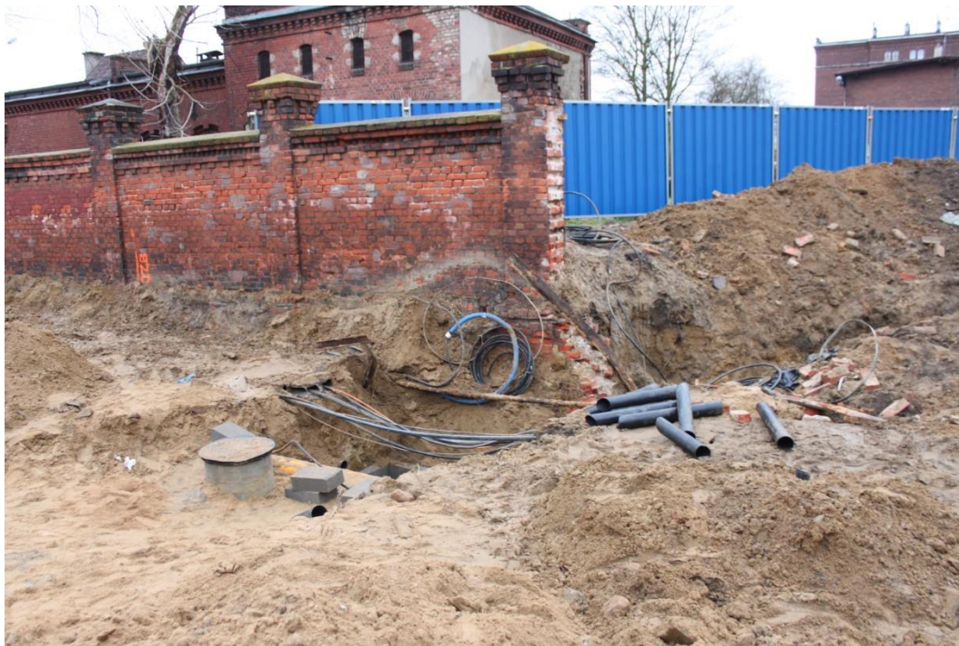
skrzyżowanie ul. Potulickiej z Narutowicza

Umowa o dofinansowanie nr: UDA-RPZP.02.01.03-32-001/13-00 z dnia 26. 09.2013 roku.