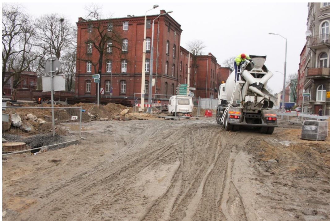
skrzyżowanie ul. Potulickiej z Narutowicza