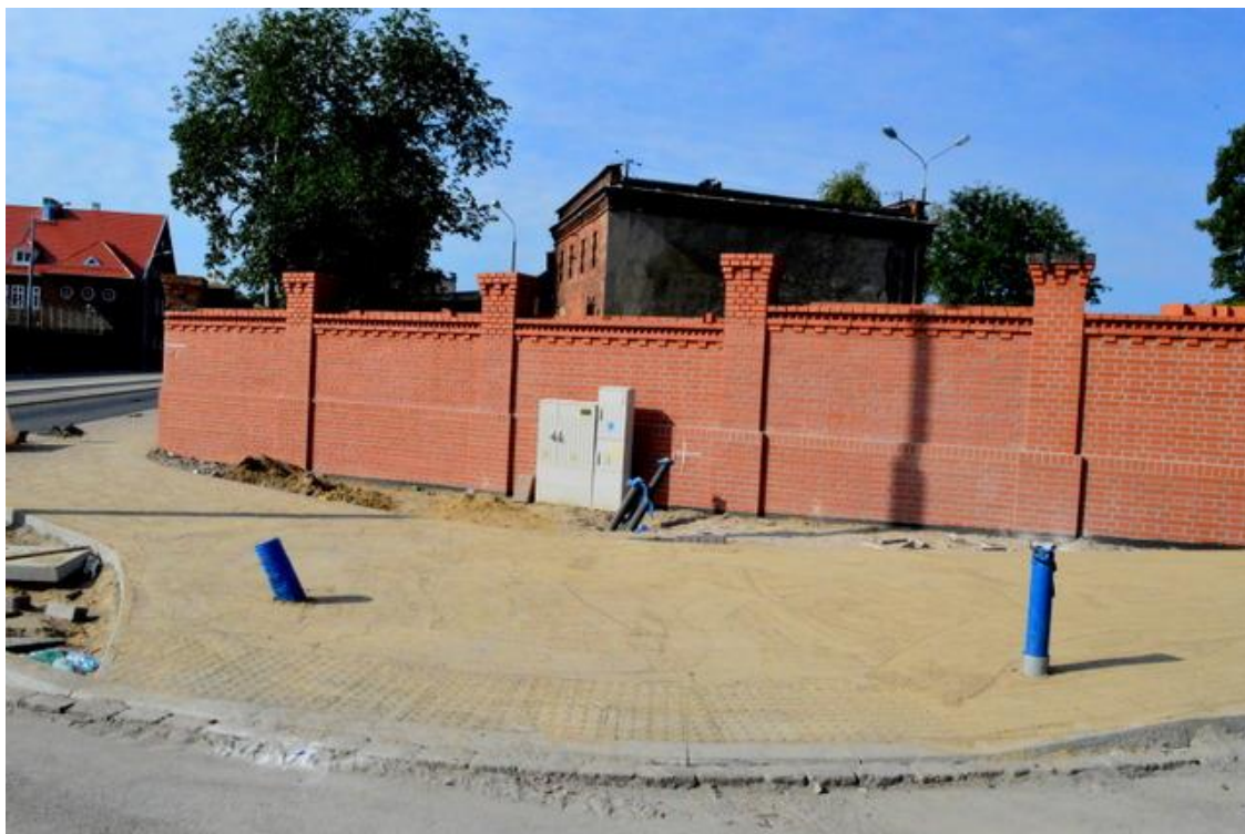
skrzyżowanie ul. Potulickiej z ul. Narutowicza