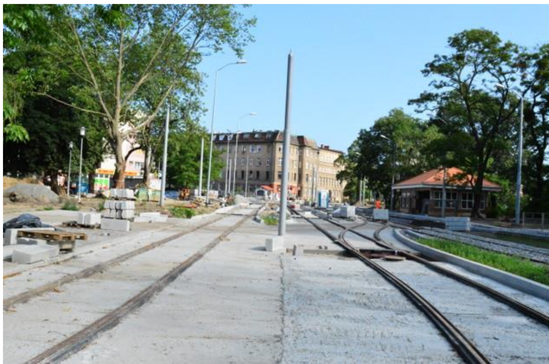
ul. Potulicka – pętla tramwajowa

Umowa o dofinansowanie nr: UDA-RPZP.02.01.03-32-001/13-00 z dnia 26. 09.2013 roku.