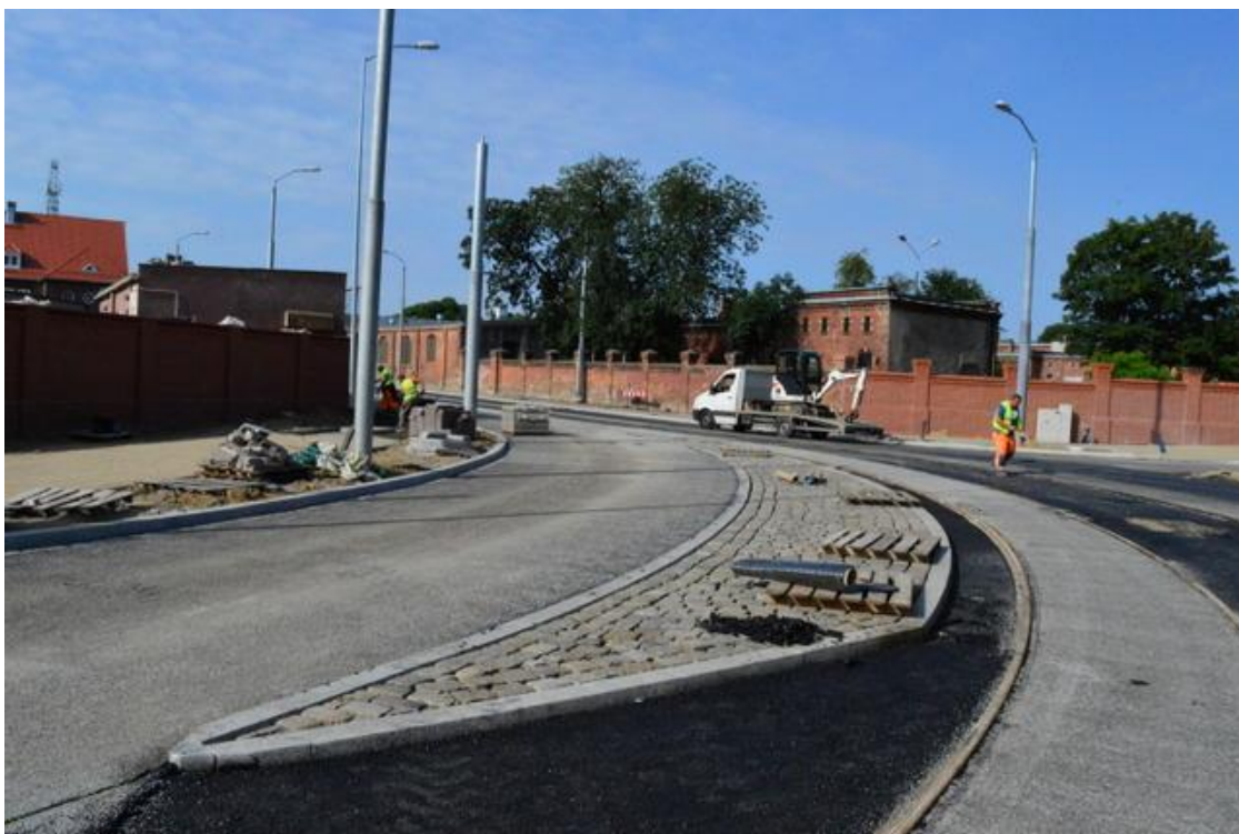
skrzyżowanie ul. Potulickiej z ul. Narutowicza

Umowa o dofinansowanie nr: UDA-RPZP.02.01.03-32-001/13-00 z dnia 26. 09.2013 roku.