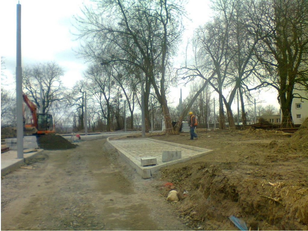
ul. Potulicka - pętla tramwajowa

Umowa o dofinansowanie nr: UDA-RPZP.02.01.03-32-001/13-00 z dnia 26. 09.2013 roku.