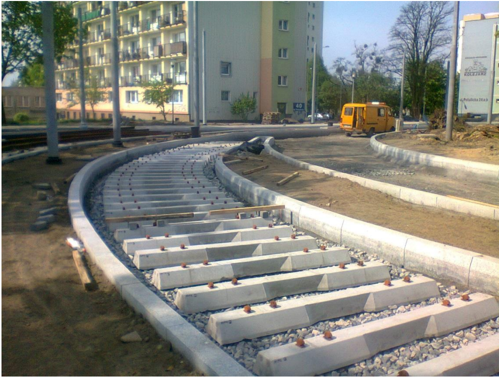
ul. Potulicka – pętla tramwajowa

Umowa o dofinansowanie nr: UDA-RPZP.02.01.03-32-001/13-00 z dnia 26. 09.2013 roku.