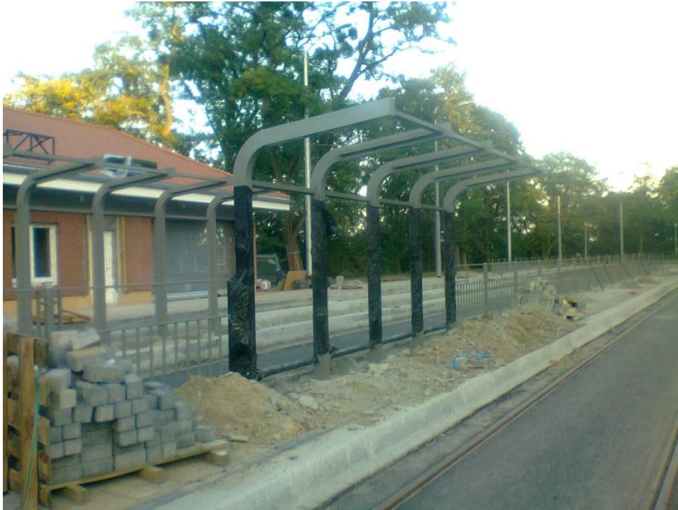
ul. Potulicka, pętla tramwajowa