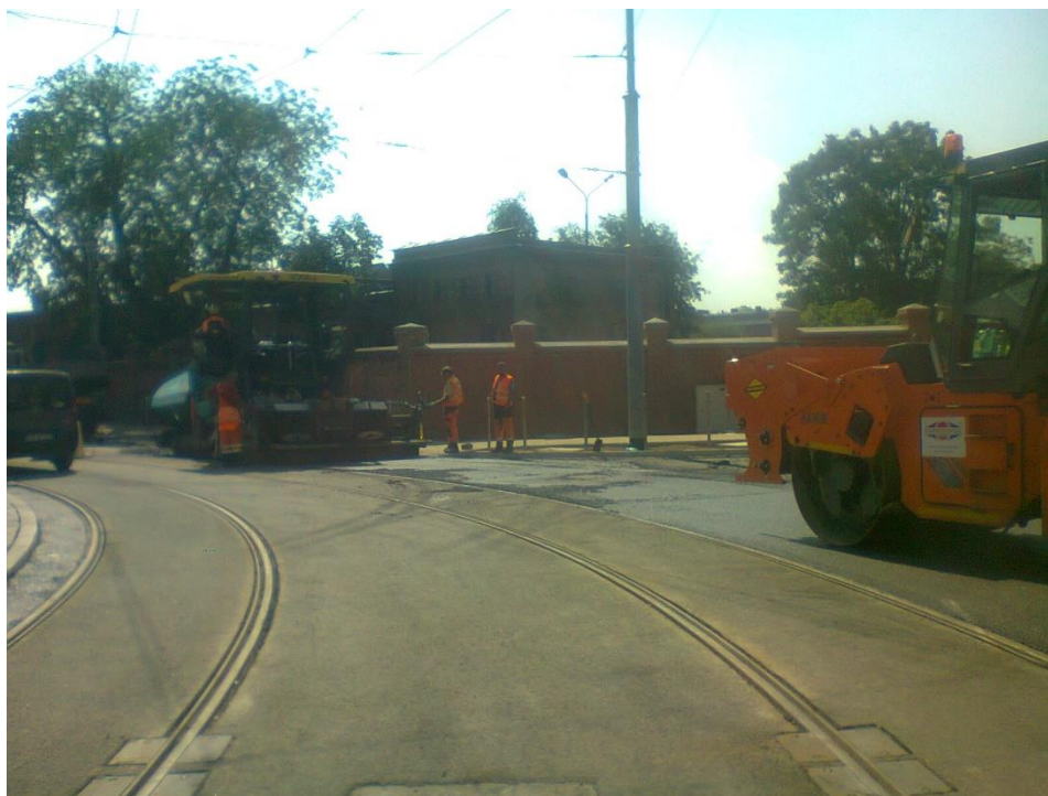
skrzyżowanie ul. Potulickiej i Narutowicza

Umowa o dofinansowanie nr: UDA-RPZP.02.01.03-32-001/13-00 z dnia 26. 09.2013 roku.