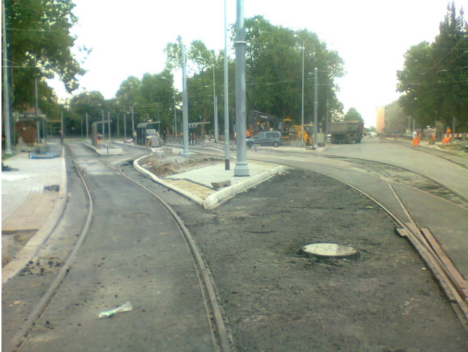
ul. Potulicka, pętla tramwajowa

Umowa o dofinansowanie nr: UDA-RPZP.02.01.03-32-001/13-00 z dnia 26. 09.2013 roku.