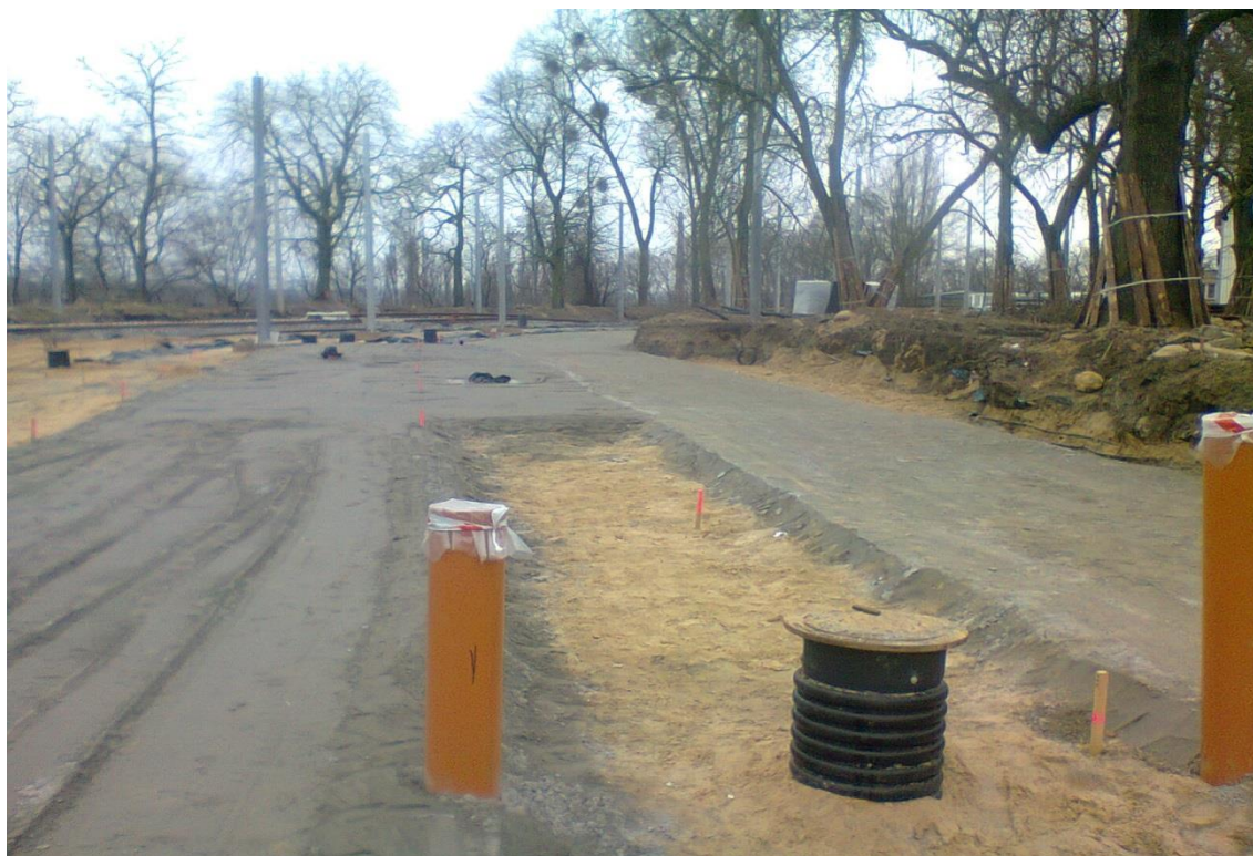
ul. Potulicka – teren pętli tramwajowej

Umowa o dofinansowanie nr: UDA-RPZP.02.01.03-32-001/13-00 z dnia 26. 09.2013 roku.