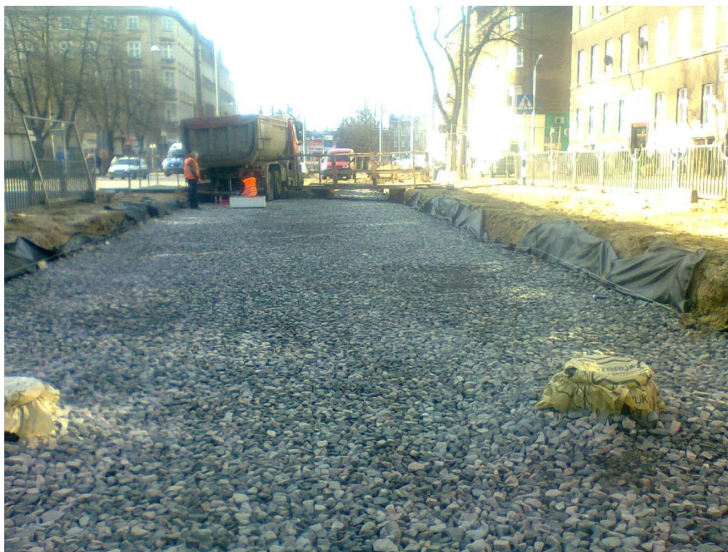
ul. 3 Maja

Umowa o dofinansowanie nr: UDA-RPZP.02.01.03-32-001/13-00 z dnia 26. 09.2013 roku.