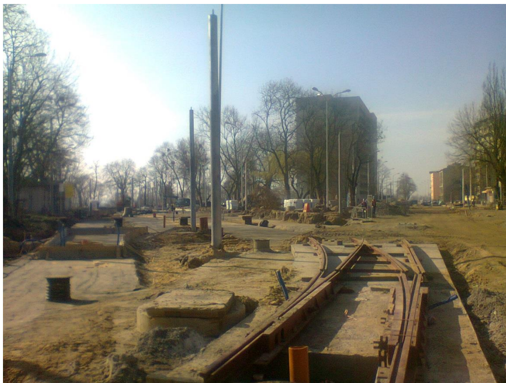
ul. Potulicka - pętla tramwajowa

Umowa o dofinansowanie nr: UDA-RPZP.02.01.03-32-001/13-00 z dnia 26. 09.2013 roku.