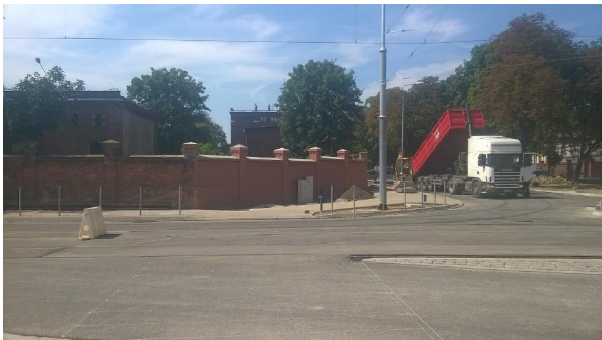
skrzyżowanie ul. Potulickiej z ul. Narutowicza