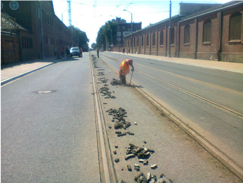
wykuwanie rowka przyszynowego

Umowa o dofinansowanie nr: UDA-RPZP.02.01.03-32-001/13-00 z dnia 26. 09.2013 roku.