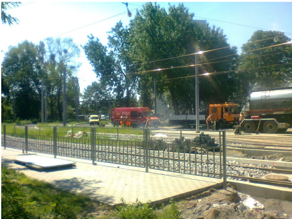
ul. Potulicka – pętla tramwajowa