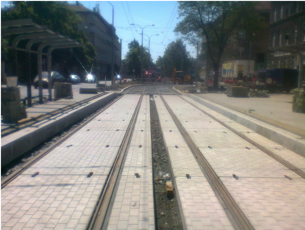
ul. 3 Maja