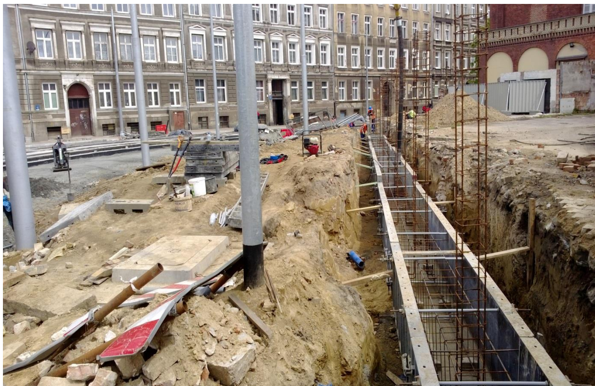
skrzyżowanie ul. Potulickiej z ul. Narutowicza

Umowa o dofinansowanie nr: UDA-RPZP.02.01.03-32-001/13-00 z dnia 26. 09.2013 roku.