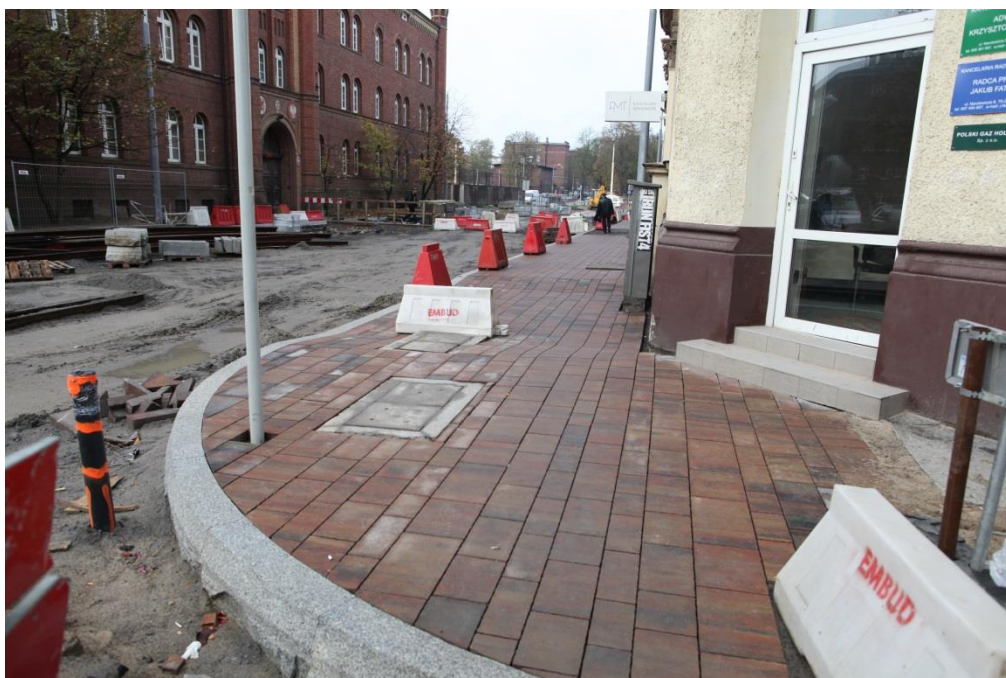
ul. Narutowicza - nawierzchnia chodnika z płytek Lido

Inżynier Kontraktu: NBQ Spółka z o.o. adres do korespondencji: 70-660 Szczecin, ul. Gdańska 3C tel. 91 423 74 68, fax 91 423 26 12