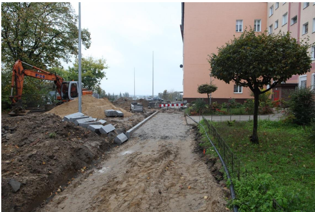
ul. Potulicka – układanie obrzeży chodnikowych

Umowa o dofinansowanie nr: UDA-RPZP.02.01.03-32-001/13-00 z dnia 26. 09.2013 roku.