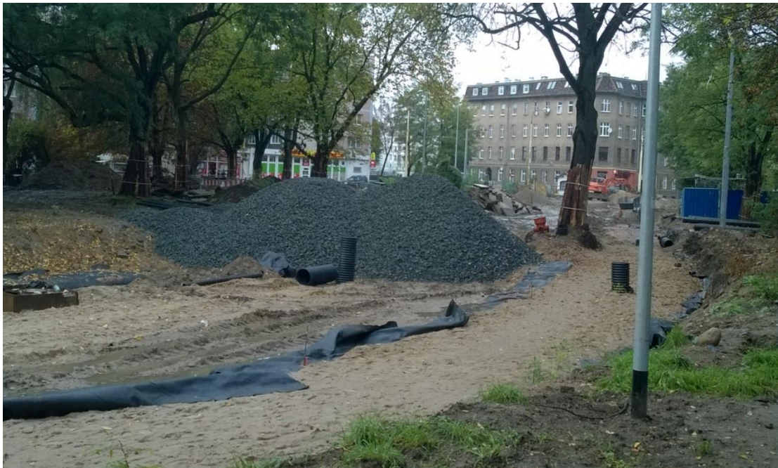
ul. Potulicka – magazynowanie tłucznia do wykonania podbudowy torowiska na terenie pętli tramwajowej