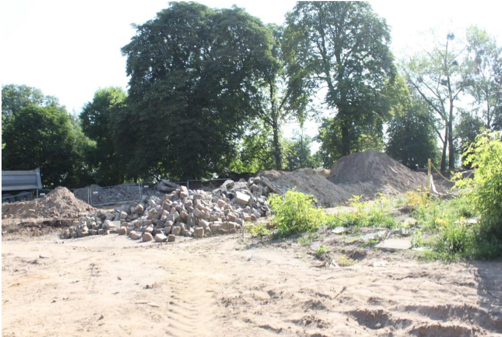
ul. Potulicka – teren pętli tramwajowej

Umowa o dofinansowanie nr: UDA-RPZP.02.01.03-32-001/13-00 z dnia 26. 09.2013 roku.