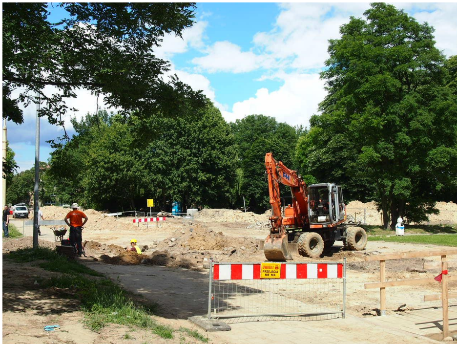
ul. Potulicka – roboty branży elektrycznej

Inżynier Kontraktu: NBQ Spółka z o.o. adres do korespondencji: 70-660 Szczecin, ul. Gdańska 3C tel. 91 423 74 68, fax 91 423 26 12