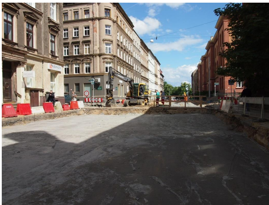
ul. Narutowicza – wykonywanie wzmocnienia podłoża warstwą stabilizacji grunto-cementem

Inżynier Kontraktu: NBQ Spółka z o.o. adres do korespondencji: 70-660 Szczecin, ul. Gdańska 3C tel. 91 423 74 68, fax 91 423 26 12