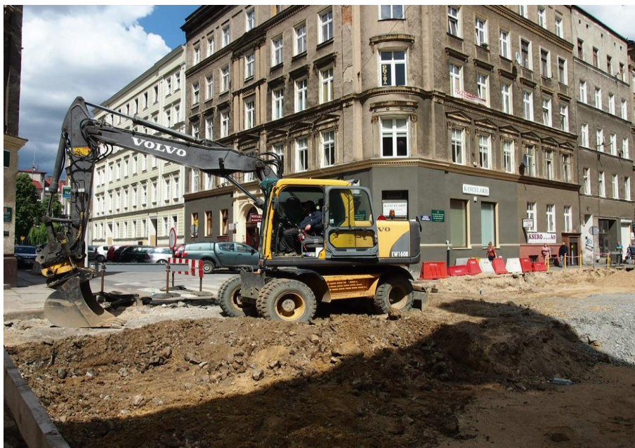
skrzyżowanie ul. Narutowicza, ul. Kaszubska – roboty ziemne

Umowa o dofinansowanie nr: UDA-RPZP.02.01.03-32-001/13-00 z dnia 26. 09.2013 roku.