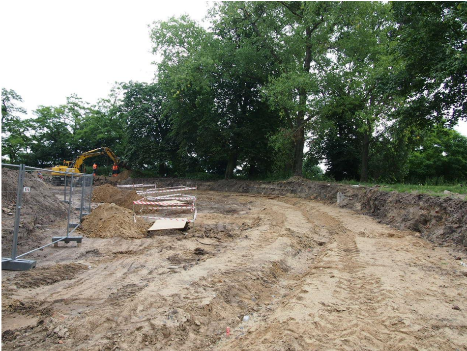
ul. Potulicka – wykonanie fundamentów pod słupy trakcyjne na pętli tramwajowej;