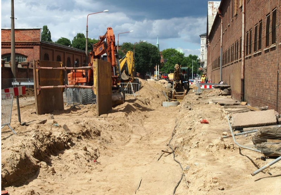
ul. Potulicka – roboty branży sanitarnej

Umowa o dofinansowanie nr: UDA-RPZP.02.01.03-32-001/13-00 z dnia 26. 09.2013 roku.