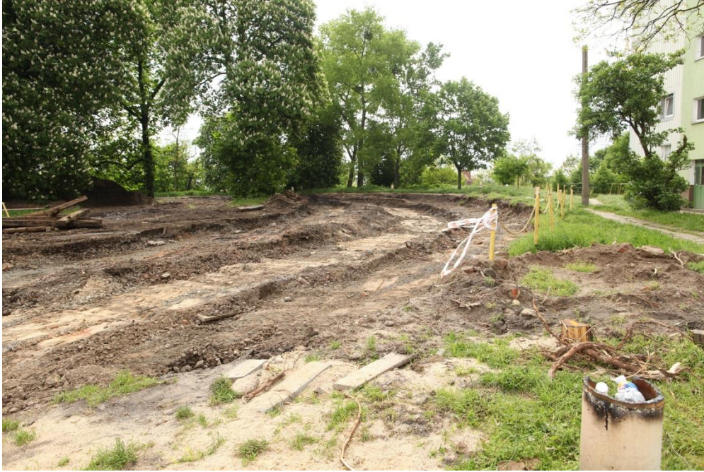
ul. Potulicka – teren po pętli tramwajowej

Umowa o dofinansowanie nr: UDA-RPZP.02.01.03-32-001/13-00 z dnia 26. 09.2013 roku.