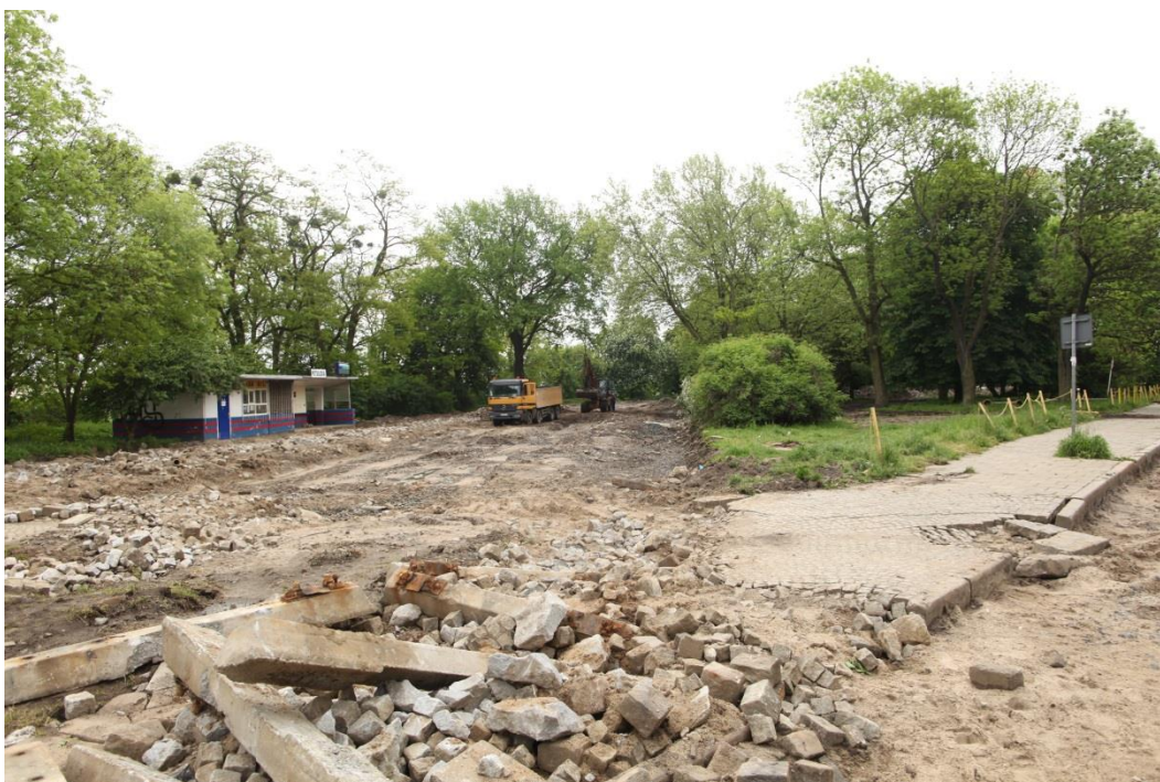
ul. Potulicka – teren po pętli tramwajowej