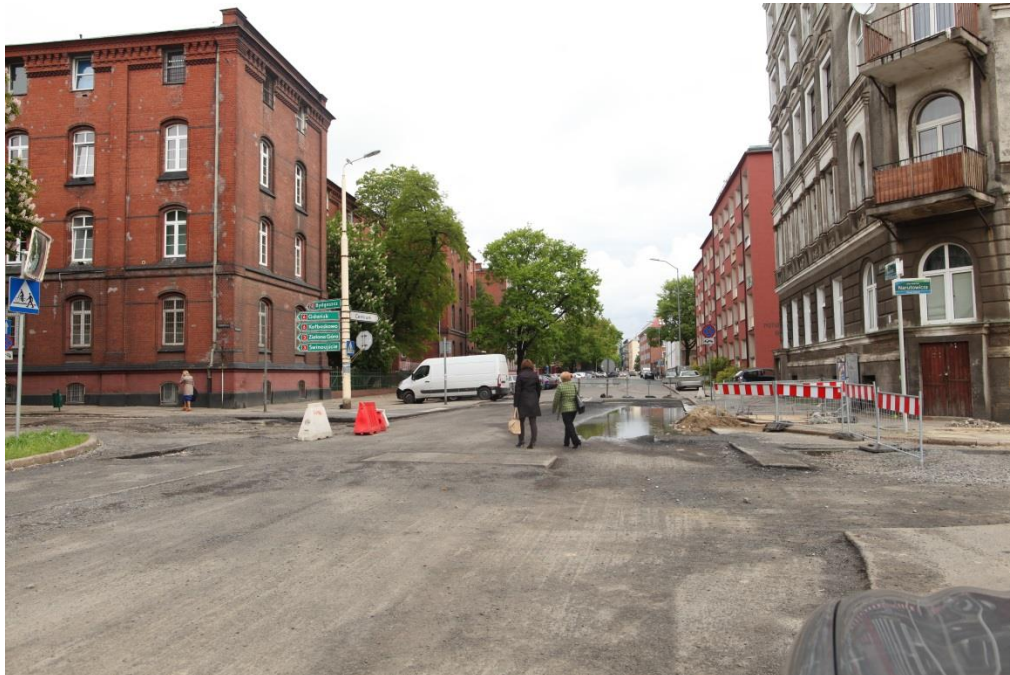
skrzyżowanie ul. Narutowicza i ul. Potulickiej

Inżynier Kontraktu: NBQ Spółka z o.o. adres do korespondencji: 70-660 Szczecin, ul. Gdańska 3C tel. 91 423 74 68, fax 91 423 26 12