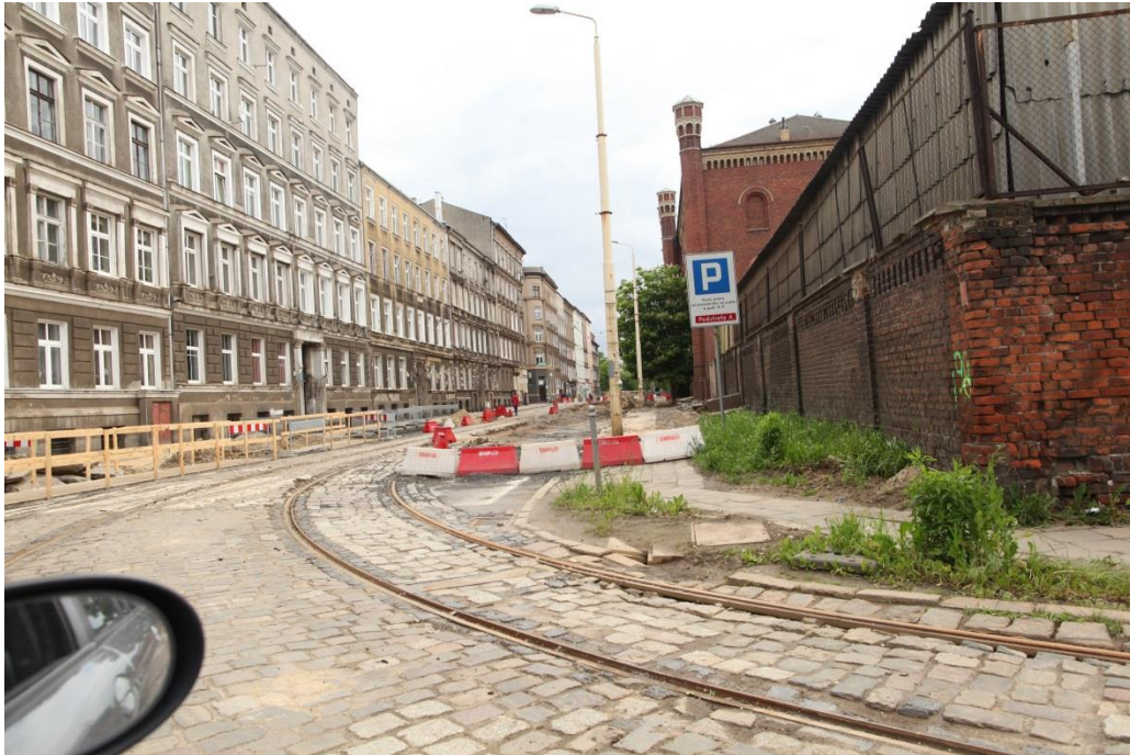
ul. 3 Maja

Umowa o dofinansowanie nr: UDA-RPZP.02.01.03-32-001/13-00 z dnia 26. 09.2013 roku.