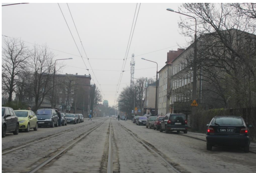
ul. Potulicka – stan obecny