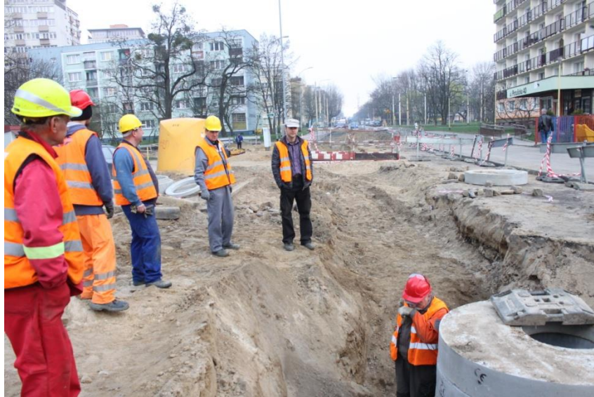
skrzyżowanie ul. Piekary z ul. Potulicką – wykonane prace ziemne

Umowa o dofinansowanie nr: UDA-RPZP.02.01.03-32-001/13-00 z dnia 26. 09.2013 roku.