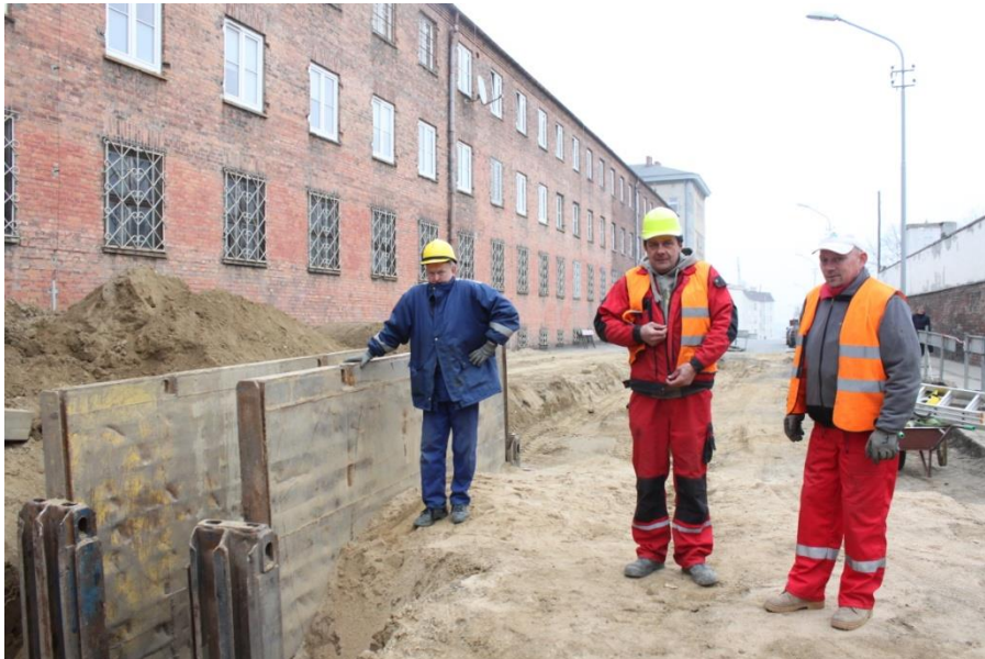
Ul. Hetmana Czarnieckiego –roboty ziemne, kanalizacja