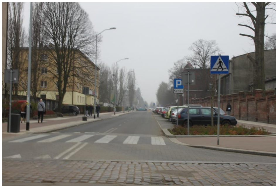
Skrzyżowanie ul. Potulickiej i Sowińskiego – stan obecny

Umowa o dofinansowanie nr: UDA-RPZP.02.01.03-32-001/13-00 z dnia 26. 09.2013 roku.