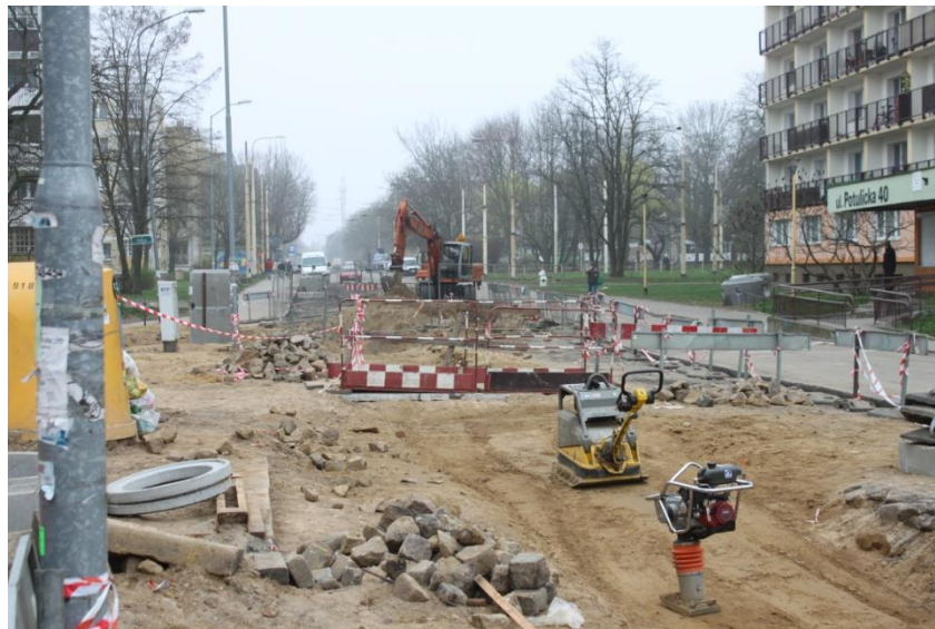
skrzyżowanie ul. Piekary z ul. Potulicką – wykonane prace ziemne