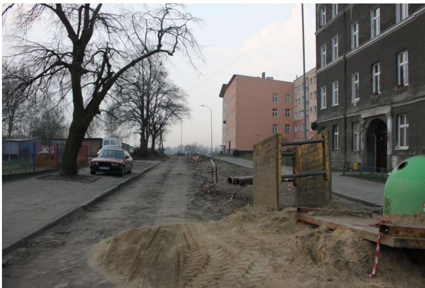
ul. Potulicka – roboty ziemne