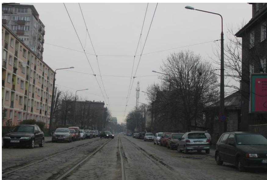
ul. Potulicka – stan obecny

Umowa o dofinansowanie nr: UDA-RPZP.02.01.03-32-001/13-00 z dnia 26. 09.2013 roku.