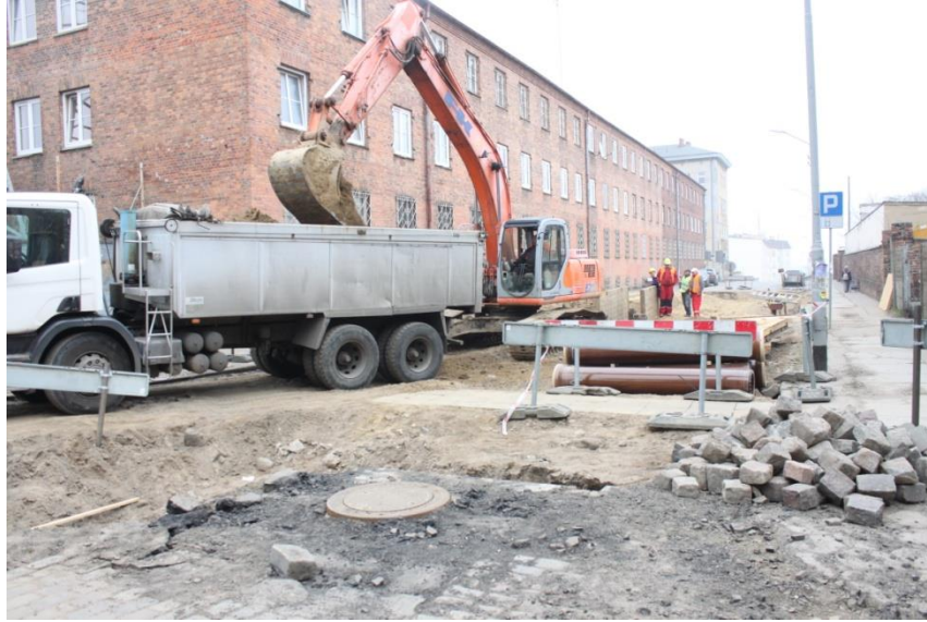
Ul. Hetmana Czarnieckiego –roboty ziemne, kanalizacja

Umowa o dofinansowanie nr: UDA-RPZP.02.01.03-32-001/13-00 z dnia 26. 09.2013 roku.