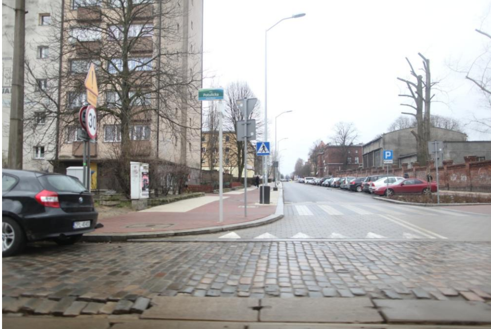
Skrzyżowanie ulic Potulickiej i Sowińskiego 17.03 2014 r

Umowa o dofinansowanie nr: UDA-RPZP.02.01.03-32-001/13-00 z dnia 26. 09.2013 roku.