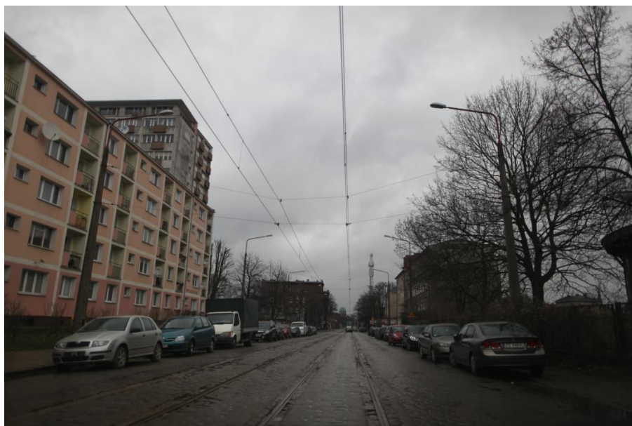
ul. Potulicka – stan obecny