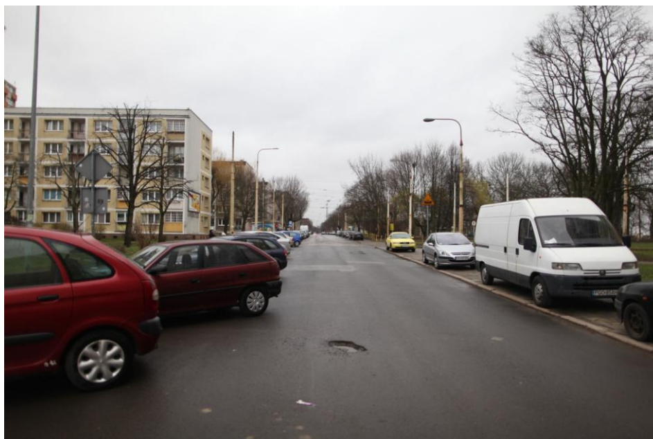
ul. Potulicka – na dzień 17.03.2014