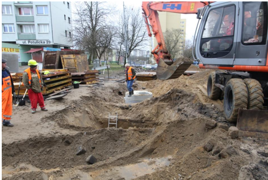
ul. Piekary – roboty ziemne