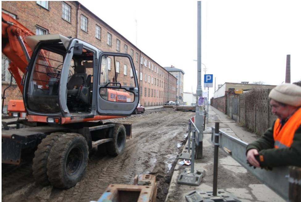
Ul. Hetmana Czarnieckiego –przygotowanie robót

Inżynier Kontraktu: NBQ Spółka z o.o. adres do korespondencji: 70-660 Szczecin, ul. Gdańska 3C tel. 91 423 74 68, fax 91 423 26 12