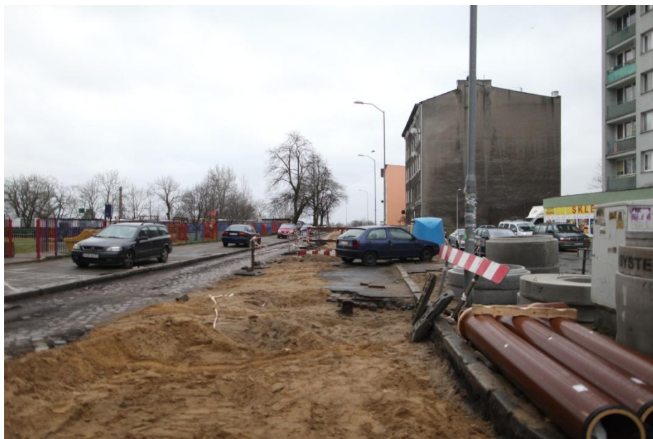
ul. Piekary– przygotowanie terenu pod prace ziemne

Umowa o dofinansowanie nr: UDA-RPZP.02.01.03-32-001/13-00 z dnia 26. 09.2013 roku.