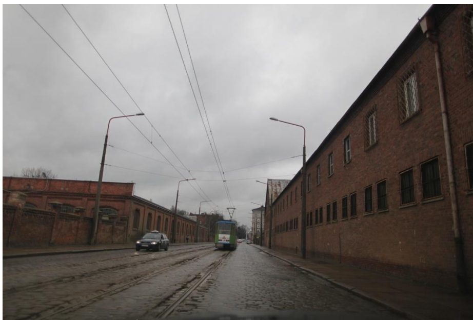
ul. Potulicka – stan obecny

Umowa o dofinansowanie nr: UDA-RPZP.02.01.03-32-001/13-00 z dnia 26. 09.2013 roku.