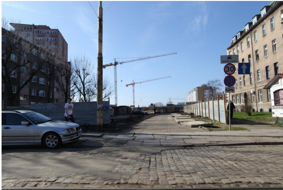
ul. Potulicka 20 – stan obecny

Umowa o dofinansowanie nr: UDA-RPZP.02.01.03-32-001/13-00 z dnia 26. 09.2013 roku.