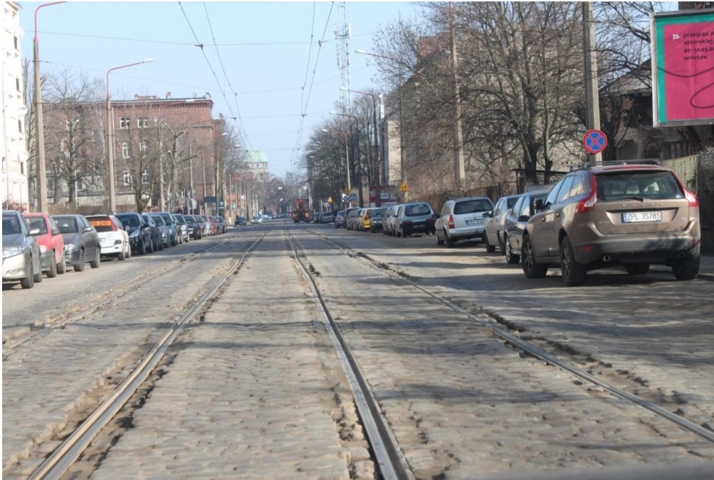
ul. Potulicka – stan obecny

Umowa o dofinansowanie nr: UDA-RPZP.02.01.03-32-001/13-00 z dnia 26. 09.2013 roku.