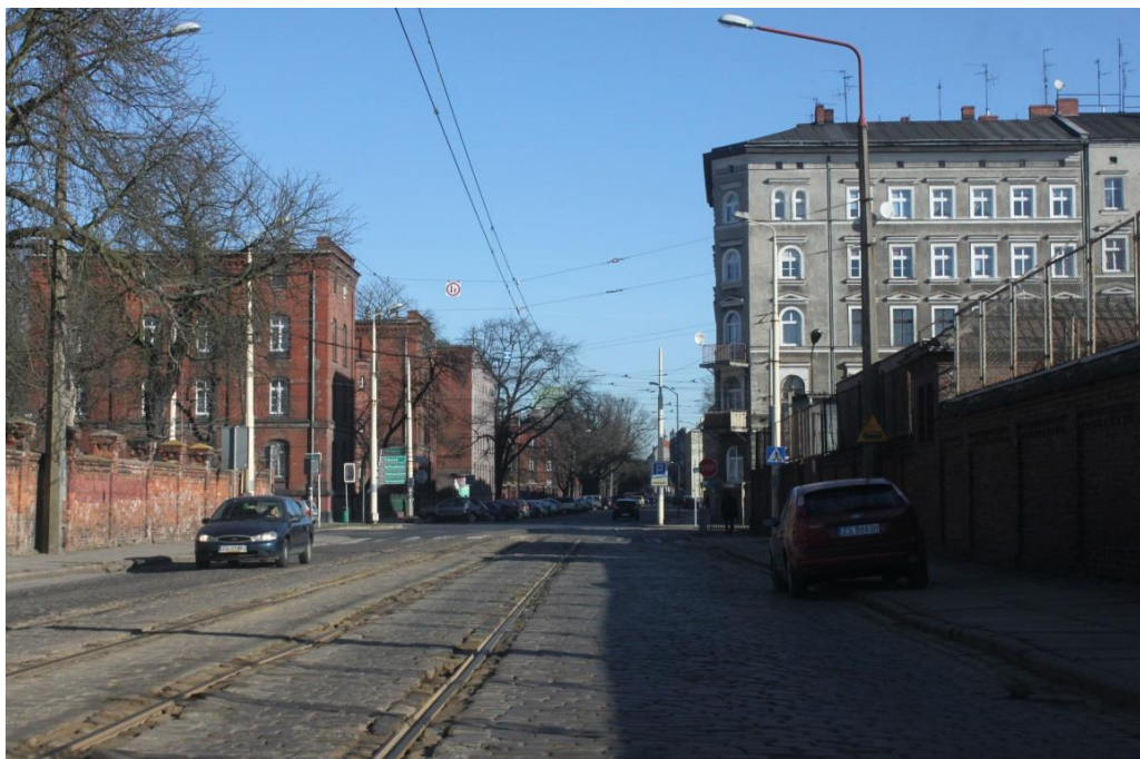
skrzyżowanie ul. Potulicka z ul. Narutowicza z ul. 3 Maja – stan obecny

Umowa o dofinansowanie nr: UDA-RPZP.02.01.03-32-001/13-00 z dnia 26. 09.2013 roku.