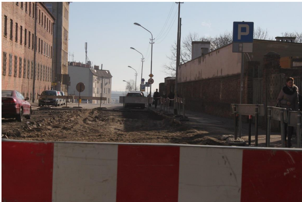
ul. Hetmana S. Czarnieckiego – wykonane roboty rozbiórkowe

Inżynier Kontraktu: NBQ Spółka z o.o. adres do korespondencji: 70-660 Szczecin, ul. Gdańska 3C tel. 91 423 74 68, fax 91 423 26 12