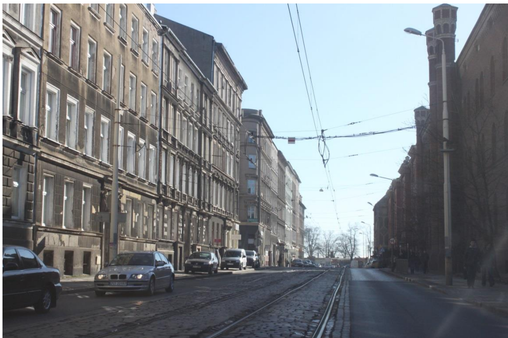
ul. Narutowicza – stan obecny

Umowa o dofinansowanie nr: UDA-RPZP.02.01.03-32-001/13-00 z dnia 26. 09.2013 roku.