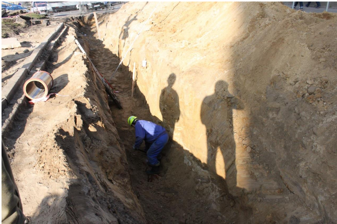
ul. Piekary – roboty ziemne