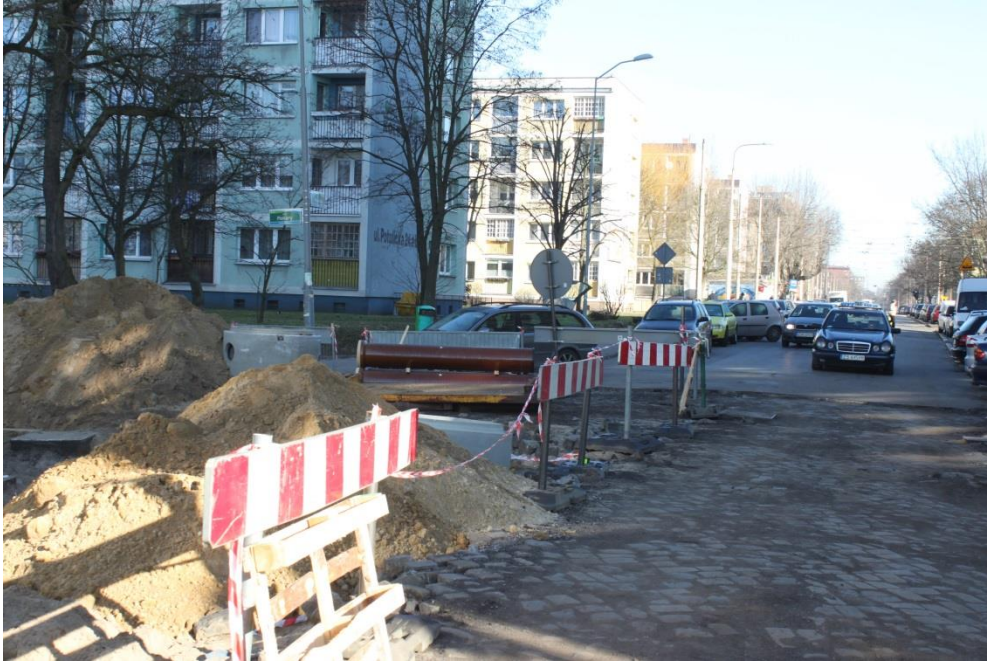
skrzyżowanie ul. Piekary z ul. Potulicką – wykonane prace ziemne

Umowa o dofinansowanie nr: UDA-RPZP.02.01.03-32-001/13-00 z dnia 26. 09.2013 roku.