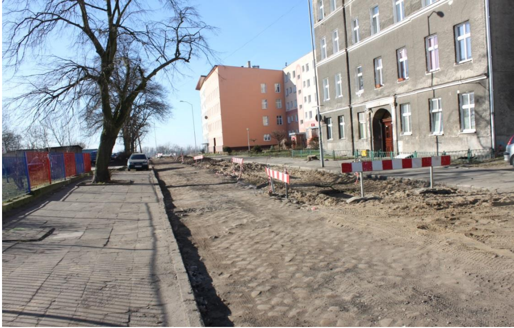
ul. Potulicka – wykonane roboty rozbiórkowe

Umowa o dofinansowanie nr: UDA-RPZP.02.01.03-32-001/13-00 z dnia 26. 09.2013 roku.