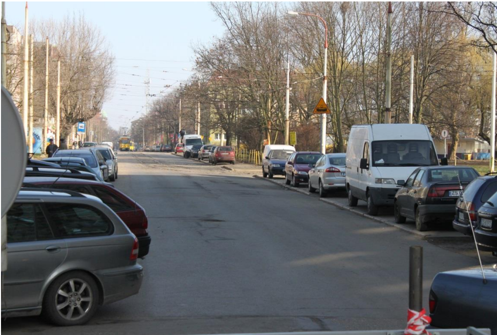
ul. Potulicka – stan obecny

Inżynier Kontraktu: NBQ Spółka z o.o. adres do korespondencji: 70-660 Szczecin, ul. Gdańska 3C tel. 91 423 74 68, fax 91 423 26 12