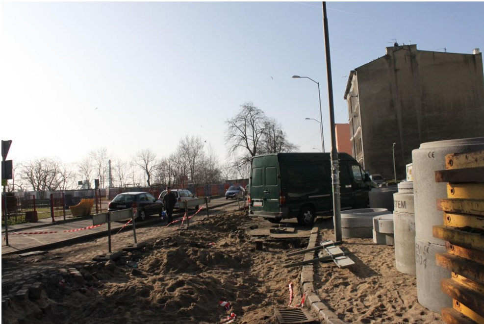
ul. Potulicka – wykonane roboty rozbiórkowe

Inżynier Kontraktu: NBQ Spółka z o.o. adres do korespondencji: 70-660 Szczecin, ul. Gdańska 3C tel. 91 423 74 68, fax 91 423 26 12