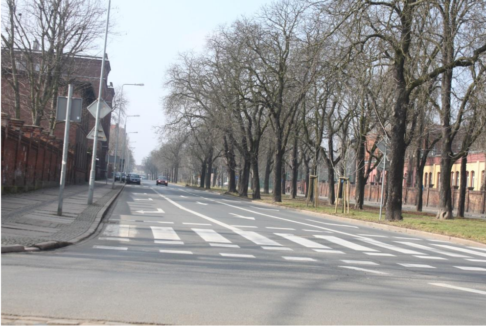
ul. Narutowicza – stan obecny

Umowa o dofinansowanie nr: UDA-RPZP.02.01.03-32-001/13-00 z dnia 26. 09.2013 roku.