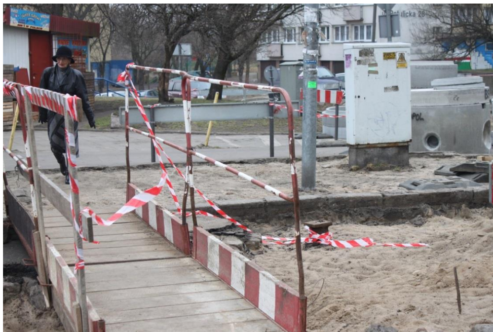
ul. Potulicka – przejście dla pieszych

Umowa o dofinansowanie nr: UDA-RPZP.02.01.03-32-001/13-00 z dnia 26. 09.2013 roku.