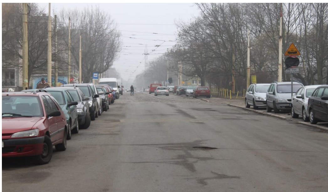
ul. Potulicka – stan obecny

Inżynier Kontraktu: NBQ Spółka z o.o. adres do korespondencji: 70-660 Szczecin, ul. Gdańska 3C tel. 91 423 74 68, fax 91 423 26 12