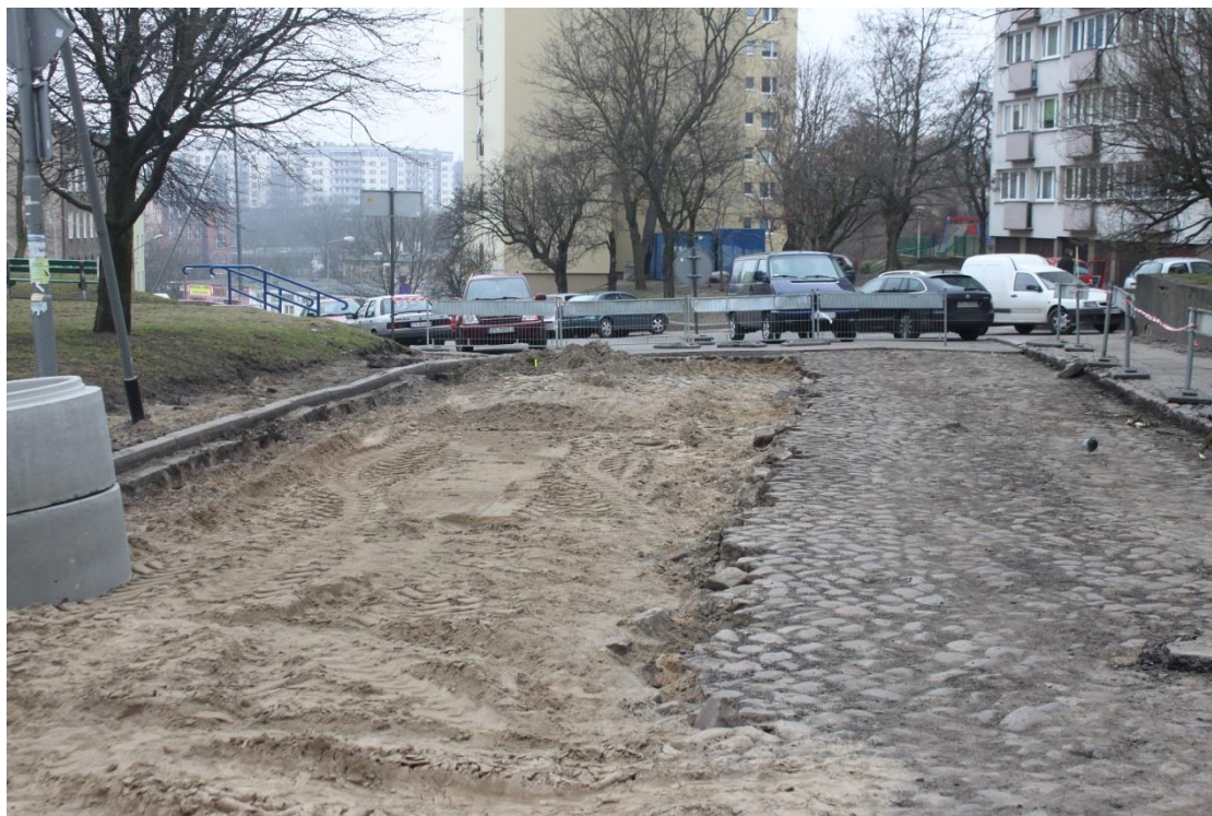
ul. Piekary – roboty rozbiórkowe