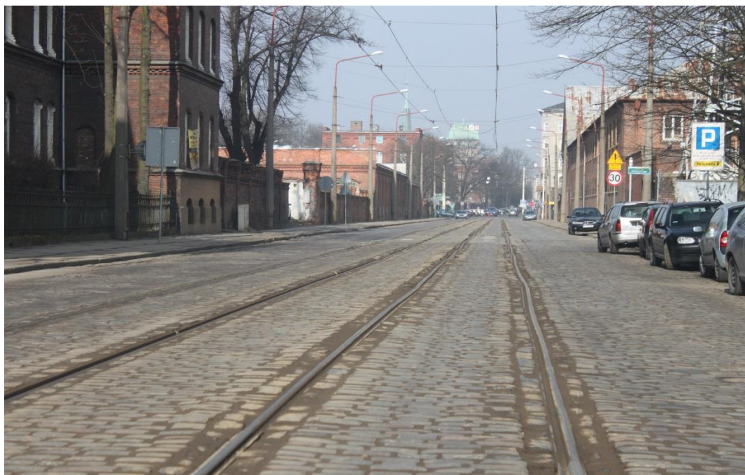
ul. Potulicka – stan obecny

Inżynier Kontraktu: NBQ Spółka z o.o. adres do korespondencji: 70-660 Szczecin, ul. Gdańska 3C tel. 91 423 74 68, fax 91 423 26 12