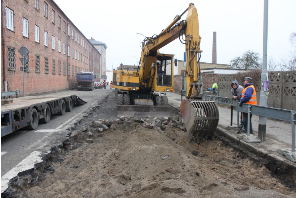
ul. Hetmana S. Czarnieckiego – roboty rozbiórkowo

Umowa o dofinansowanie nr: UDA-RPZP.02.01.03-32-001/13-00 z dnia 26. 09.2013 roku.