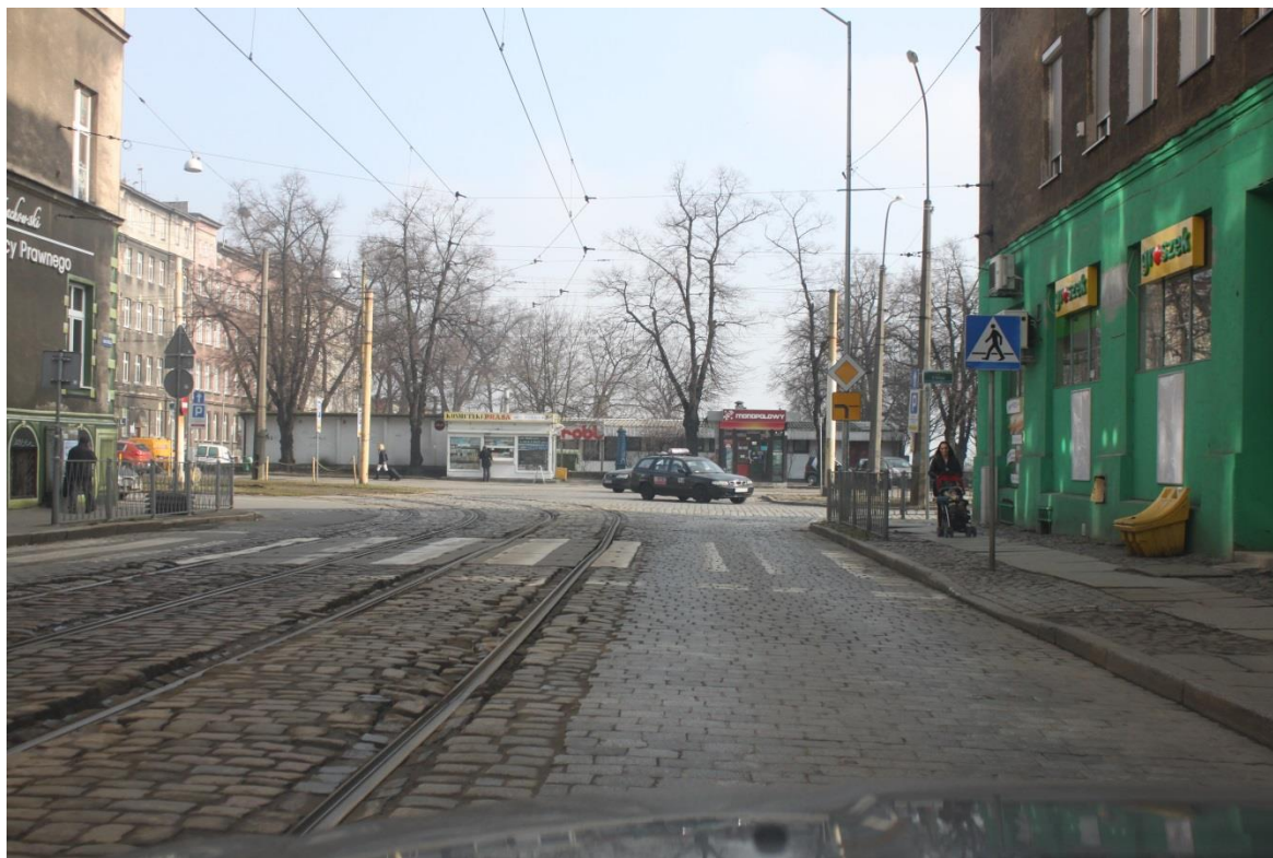
skrzyżowanie ul. Narutowicza z ul. 3 Maja – stan obecny

Umowa o dofinansowanie nr: UDA-RPZP.02.01.03-32-001/13-00 z dnia 26. 09.2013 roku.