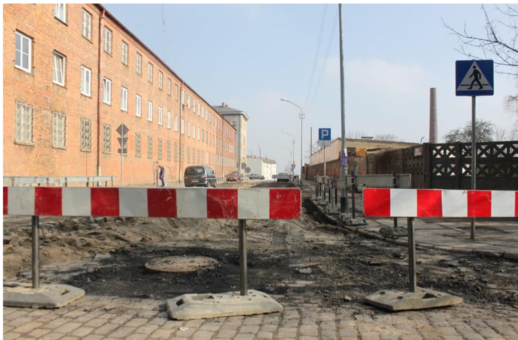
ul. Hetmana S. Czarnieckiego – roboty rozbiórkowe

Umowa o dofinansowanie nr: UDA-RPZP.02.01.03-32-001/13-00 z dnia 26. 09.2013 roku.