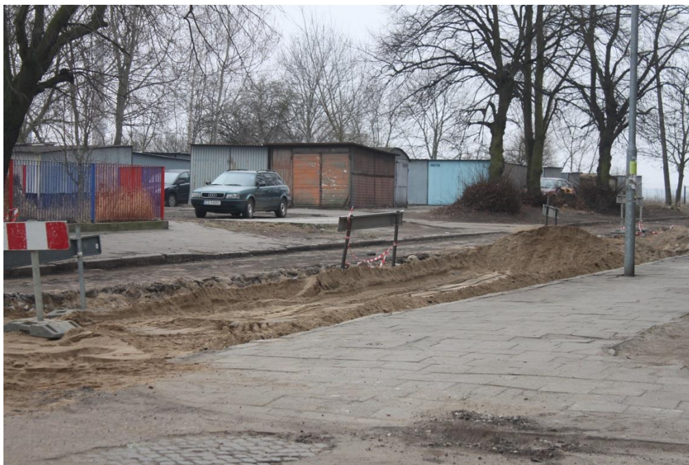
ul. Potulicka – roboty rozbiórkowe

Umowa o dofinansowanie nr: UDA-RPZP.02.01.03-32-001/13-00 z dnia 26. 09.2013 roku.