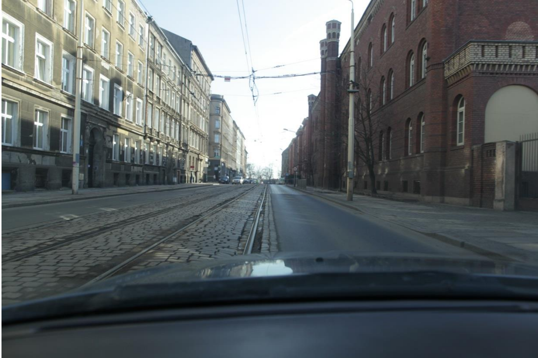
ul. Narutowicza – stan obecny

Umowa o dofinansowanie nr: UDA-RPZP.02.01.03-32-001/13-00 z dnia 26. 09.2013 roku.