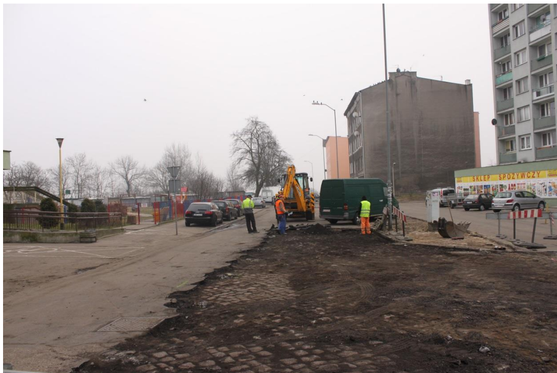
ul. Potulicka – roboty rozbiórkowe

Umowa o dofinansowanie nr: UDA-RPZP.02.01.03-32-001/13-00 z dnia 26. 09.2013 roku.