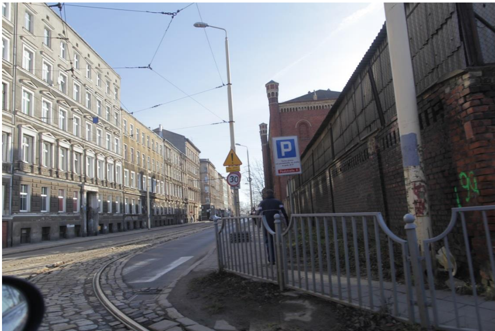
ul. Narutowicza – stan obecny

Inżynier Kontraktu: NBQ Spółka z o.o. adres do korespondencji: 70-660 Szczecin, ul. Gdańska 3C tel. 91 423 74 68, fax 91 423 26 12