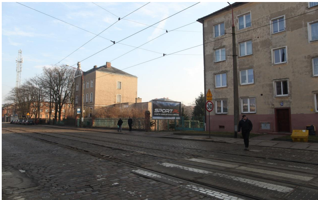
ul. Potulicka – elementy oznakowania zmiany organizacji ruchu

Umowa o dofinansowanie nr: UDA-RPZP.02.01.03-32-001/13-00 z dnia 26. 09.2013 roku.