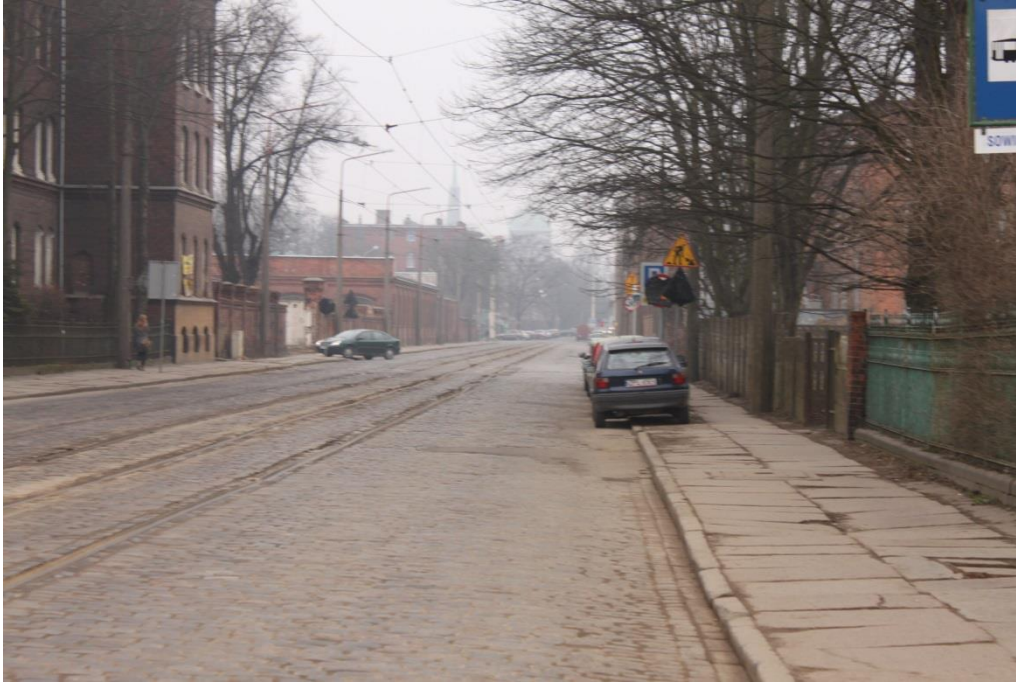
ul. Potulicka – stan obecny

Umowa o dofinansowanie nr: UDA-RPZP.02.01.03-32-001/13-00 z dnia 26. 09.2013 roku.