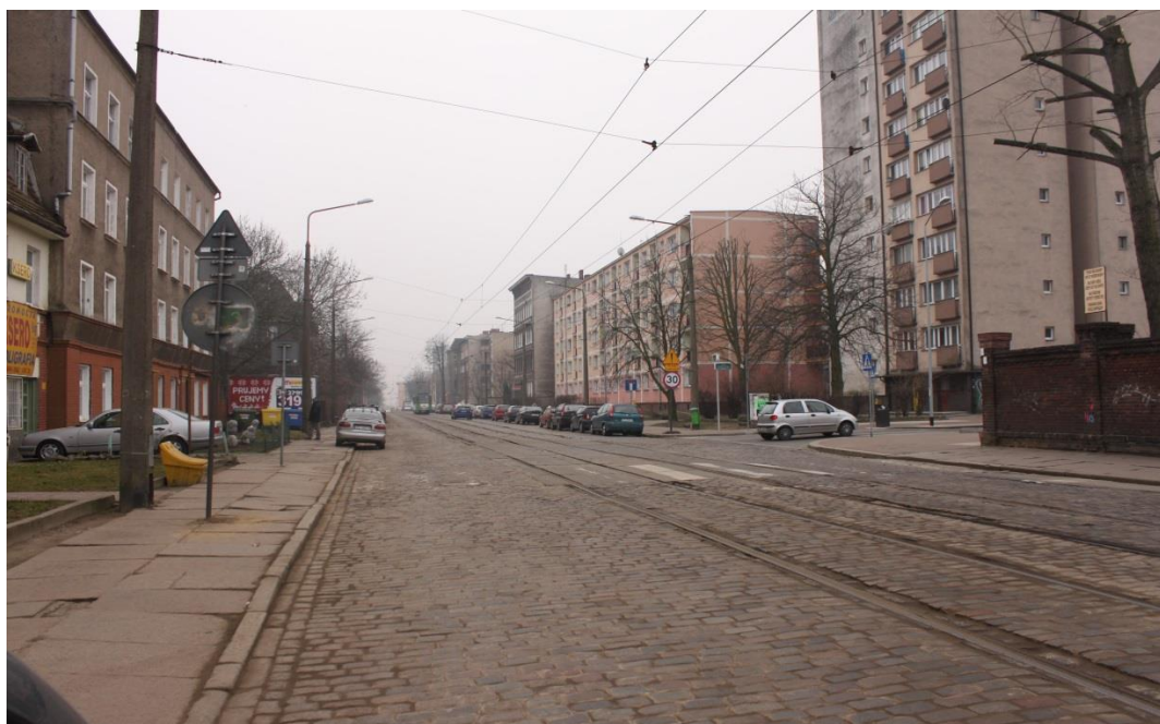
ul. Potulicka – stan obecny