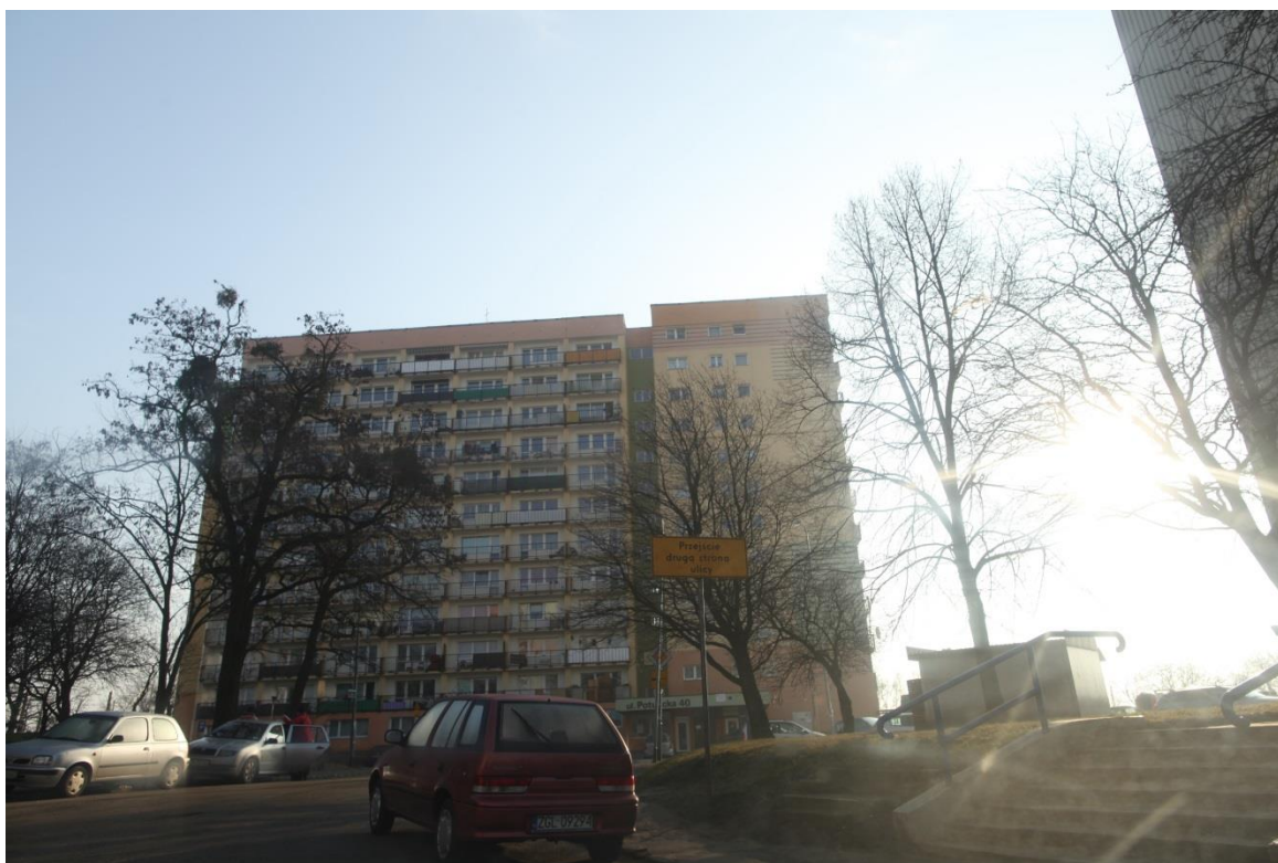
ul. Piekary – elementy oznakowania zmiany organizacji ruchu