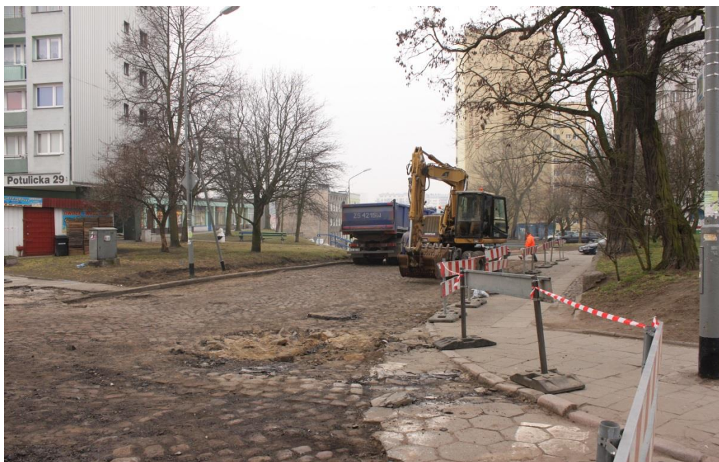
ul. Piekary – roboty rozbiórkowe

Umowa o dofinansowanie nr: UDA-RPZP.02.01.03-32-001/13-00 z dnia 26. 09.2013 roku.