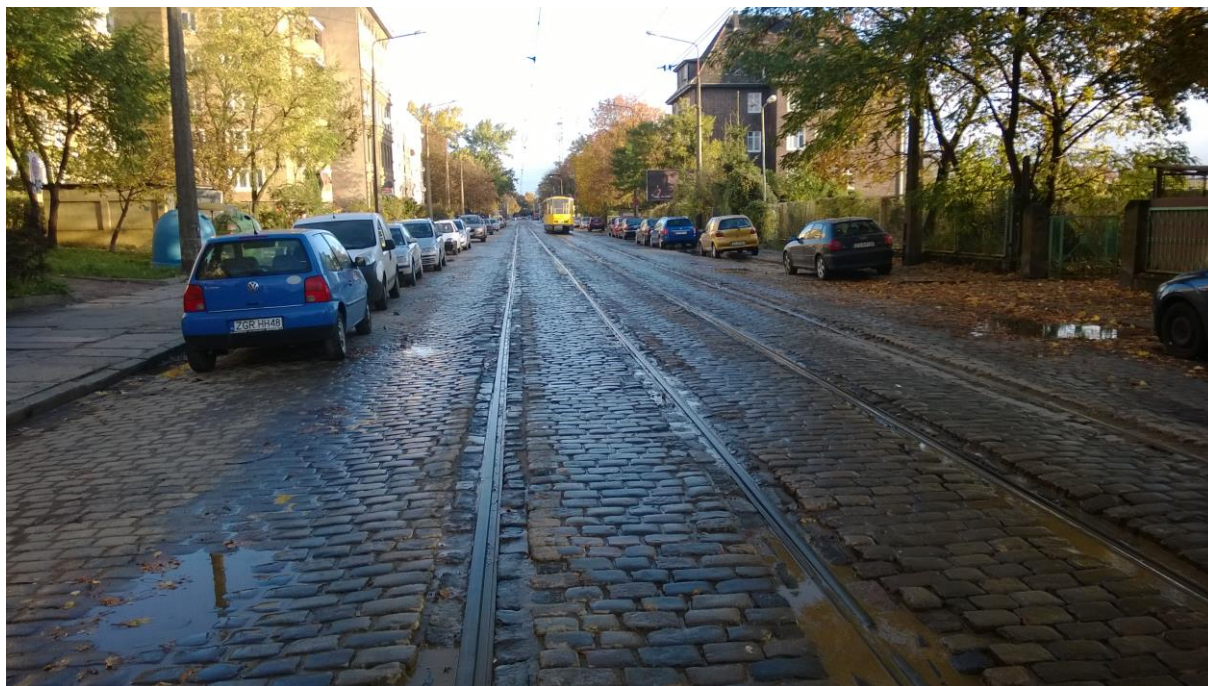
ul. Potulicka – stan obecny

Umowa o dofinansowanie nr: UDA-RPZP.02.01.03-32-001/13-00 z dnia 26. 09.2013 roku.