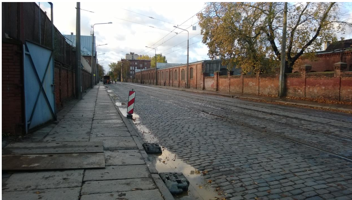
ul. Potulicka – stan obecny

Umowa o dofinansowanie nr: UDA-RPZP.02.01.03-32-001/13-00 z dnia 26. 09.2013 roku.