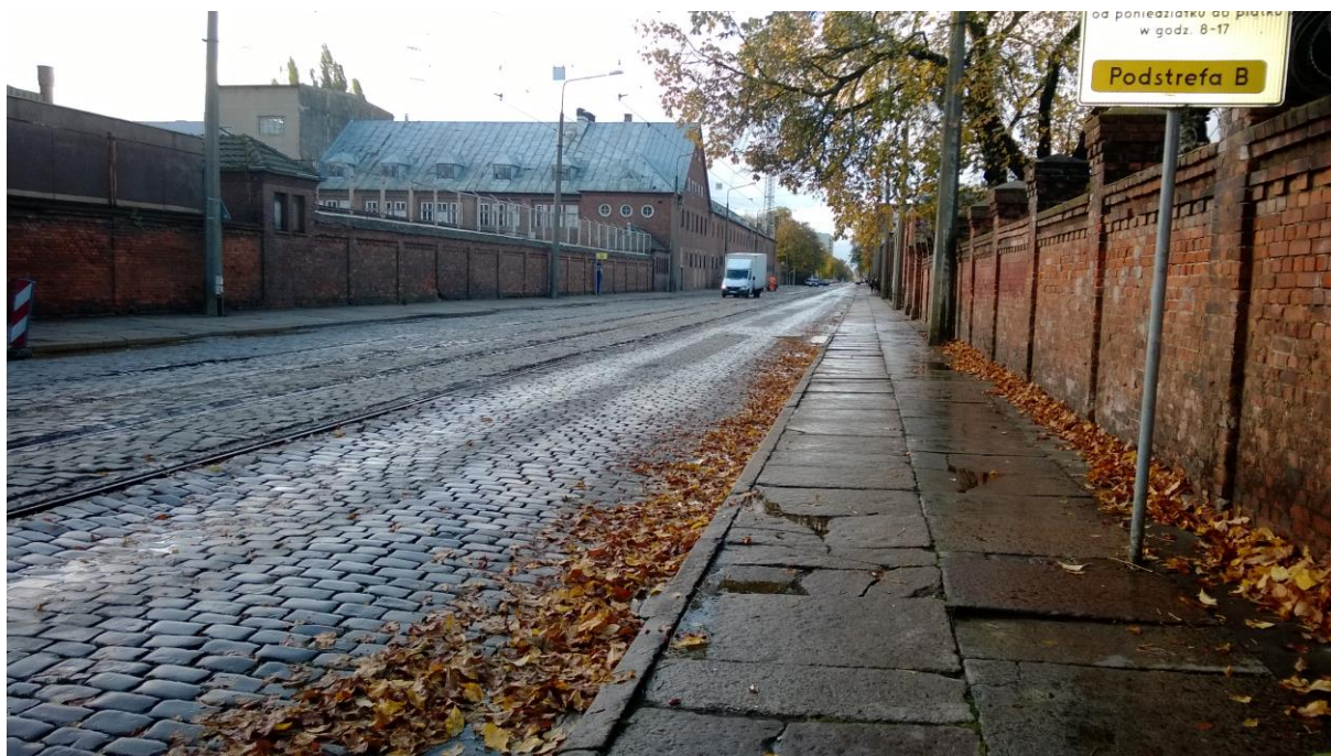
ul. Potulicka – stan obecny

Inżynier Kontraktu: NBQ Spółka z o.o. adres do korespondencji: 70-660 Szczecin, ul. Gdańska 3C tel. 91 423 74 68, fax 91 423 26 12