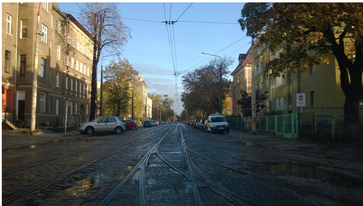
ul. Potulicka – stan obecny

Inżynier Kontraktu: NBQ Spółka z o.o. adres do korespondencji: 70-660 Szczecin, ul. Gdańska 3C tel. 91 423 74 68, fax 91 423 26 12