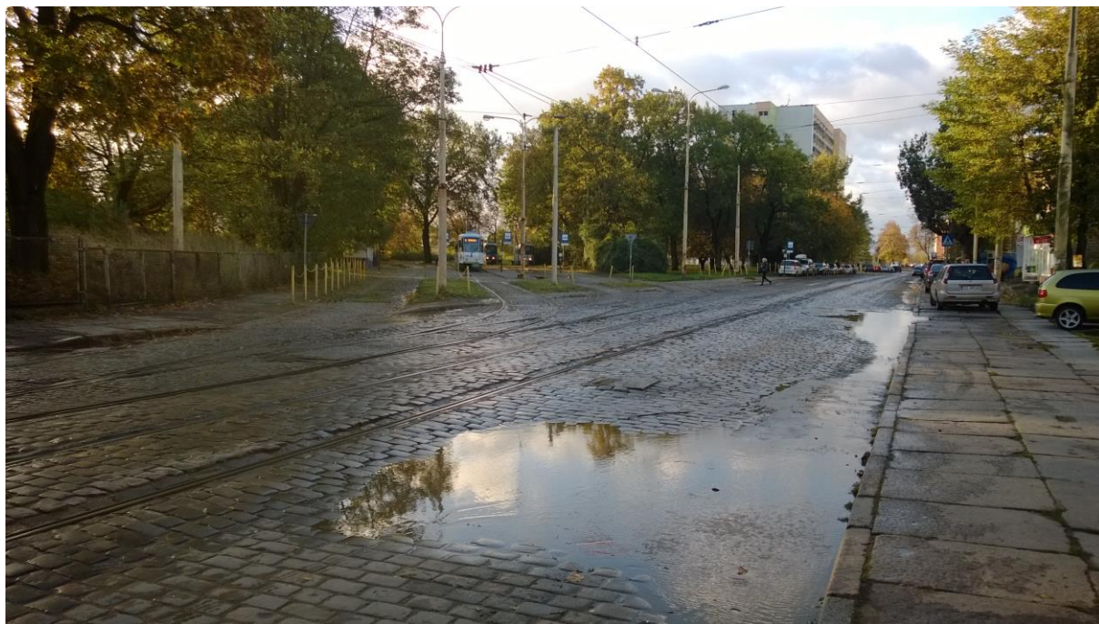
ul. Potulicka – pętla tramwajowa – stan obecny

Umowa o dofinansowanie nr: UDA-RPZP.02.01.03-32-001/13-00 z dnia 26. 09.2013 roku.