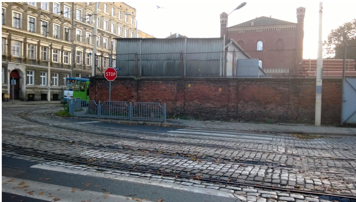
skrzyżowanie ul. Potulickiej z ul. Narutowicza – stan obecny

Umowa o dofinansowanie nr: UDA-RPZP.02.01.03-32-001/13-00 z dnia 26. 09.2013 roku.