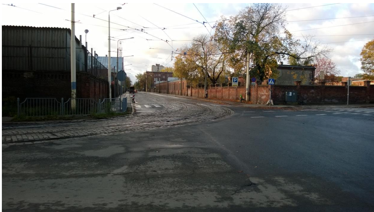
skrzyżowanie ul. Potulickiej z ul. Narutowicza – stan obecny