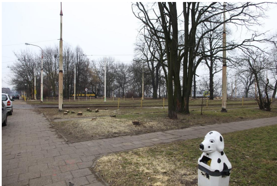
ul. Potulicka – okolice zajezdni tramwajowej – zrealizowana wycinka drzew

Umowa o dofinansowanie nr: UDA-RPZP.02.01.03-32-001/13-00 z dnia 26. 09.2013 roku.