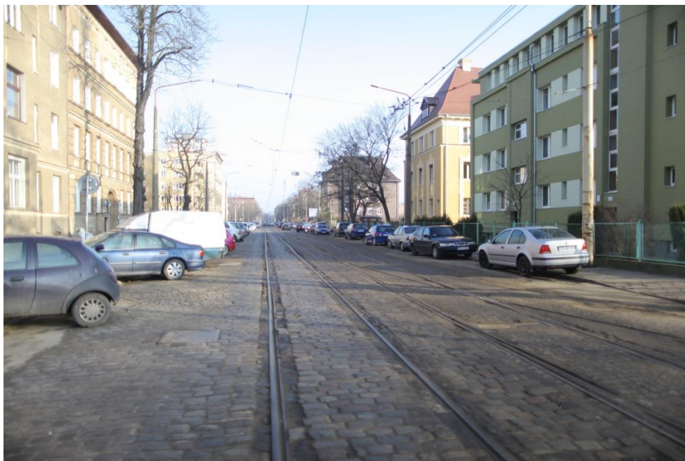
ul. Potulicka – stan obecny

Umowa o dofinansowanie nr: UDA-RPZP.02.01.03-32-001/13-00 z dnia 26. 09.2013 roku.