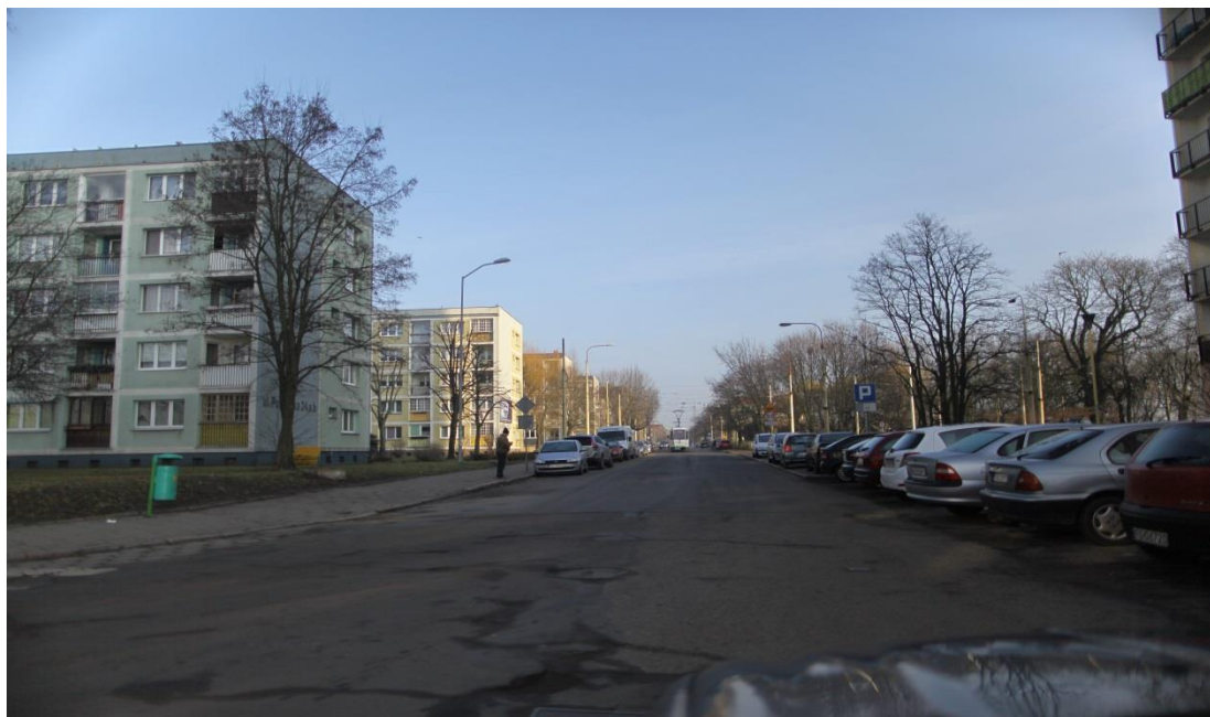
ul. Potulicka – stan obecny

Umowa o dofinansowanie nr: UDA-RPZP.02.01.03-32-001/13-00 z dnia 26. 09.2013 roku.