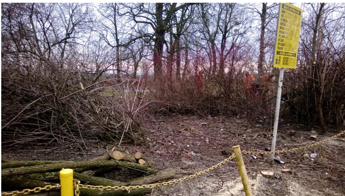
ul. Potulicka – okolice zajezdni tramwajowej – wycinka krzewów