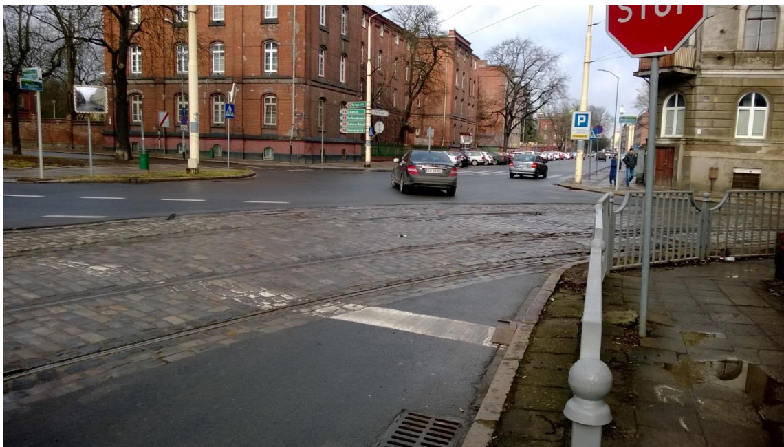
skrzyżowanie ulic Potulickiej i Narutowicza

Umowa o dofinansowanie nr: UDA-RPZP.02.01.03-32-001/13-00 z dnia 26. 09.2013 roku.