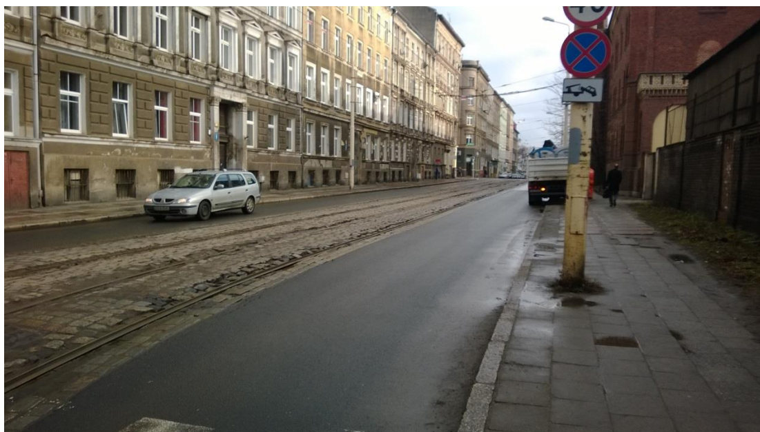
ul. Narutowicza - stan obecny

Umowa o dofinansowanie nr: UDA-RPZP.02.01.03-32-001/13-00 z dnia 26. 09.2013 roku.