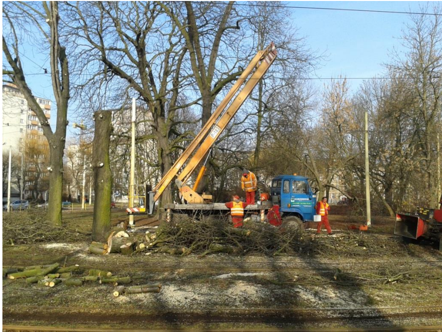
ul. Potulicka – okolice zajezdni tramwajowej – wycinka drzew i krzewów

Umowa o dofinansowanie nr: UDA-RPZP.02.01.03-32-001/13-00 z dnia 26. 09.2013 roku.