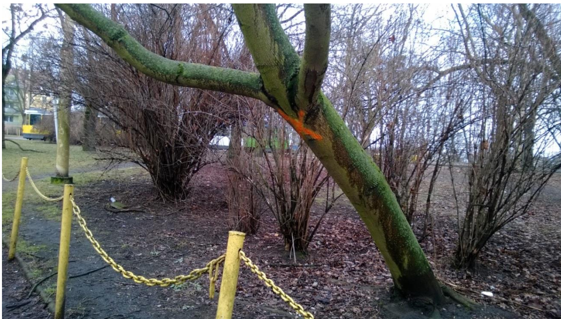
ul. Potulicka – okolice zajezdni tramwajowej – oznaczone drzewa

Umowa o dofinansowanie nr: UDA-RPZP.02.01.03-32-001/13-00 z dnia 26. 09.2013 roku.