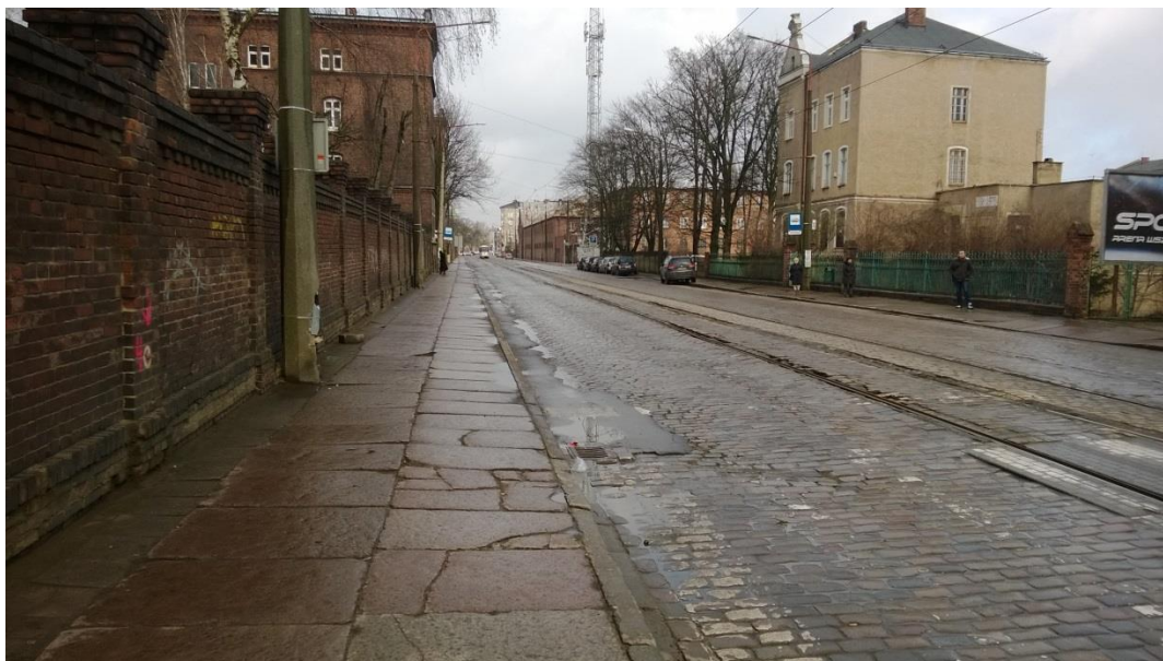
ul. Potulicka – stan obecny

Umowa o dofinansowanie nr: UDA-RPZP.02.01.03-32-001/13-00 z dnia 26. 09.2013 roku.