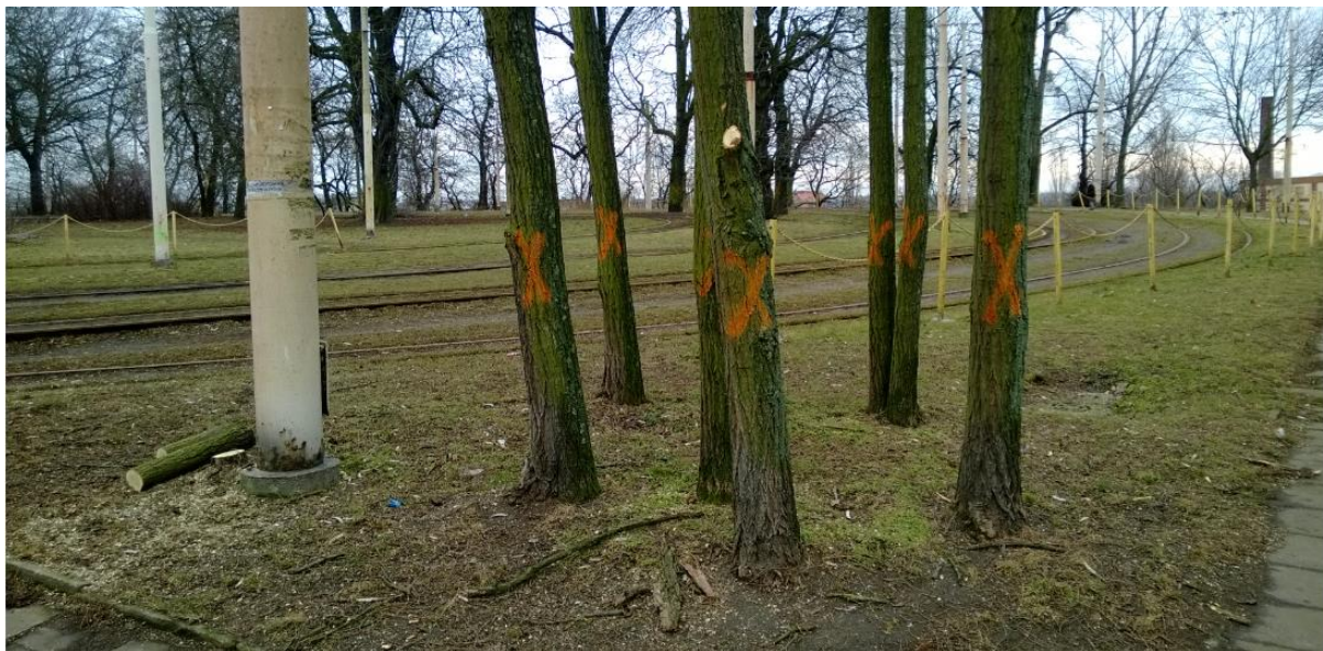
ul. Potulicka – okolice zajezdni tramwajowej – oznaczone drzewa